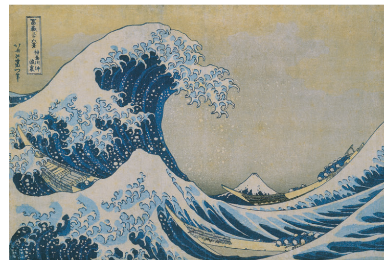
葛飾北斎「富嶽三十六景 神奈川沖浪裏」（千葉市美術館蔵）