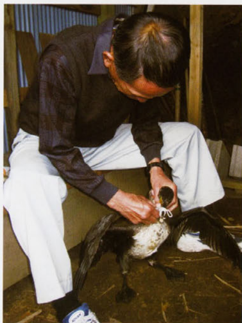
茨城県日立市十王の鶴捕り