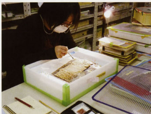
キトラ古墳天文図の修復処置