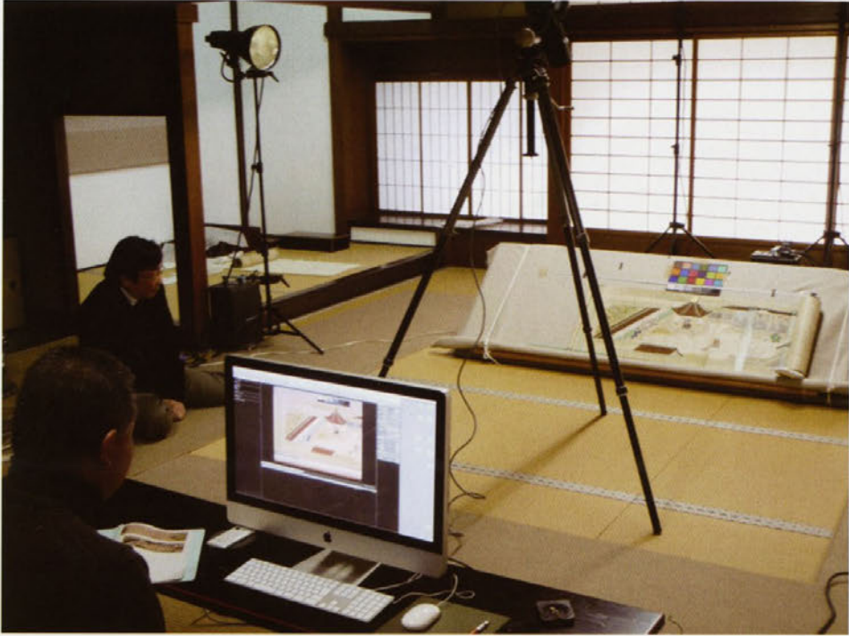
調査風景・京都佛光寺での絵巻調査