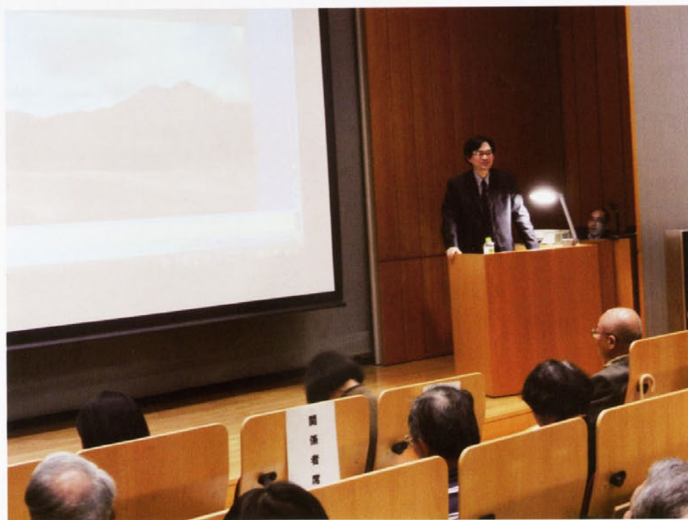
第45回オープンレクチャー モノ/イメージとの対話