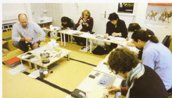
在外日本古美術品保存修復協力事業でのワークショップ