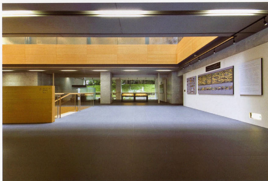
エントランス