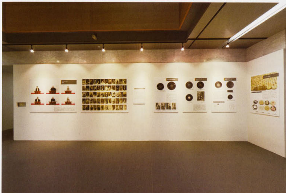
パネル展示「無形文化遺産の記録」