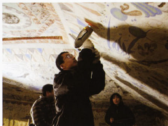
敦煌莫高窟第285窟での日中共同調査