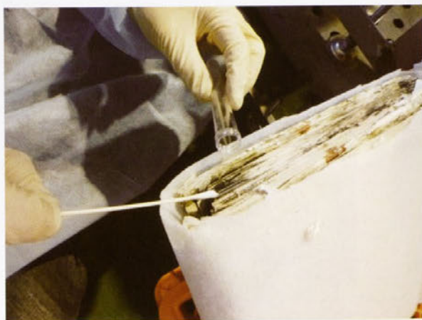
文化財レスキュー事業での 水損した被災文書の微生物被害の調査