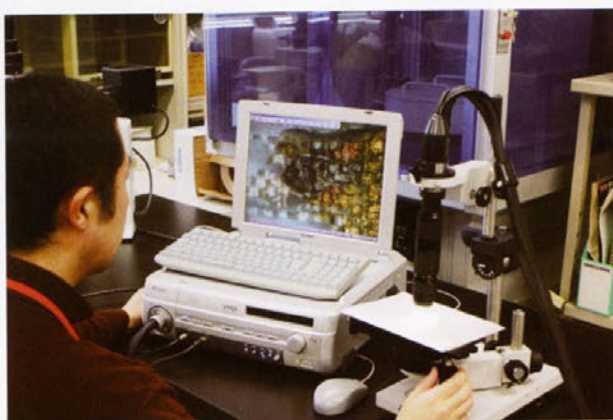
デジタルマイクロスコープによる能装束断片の拡大観察