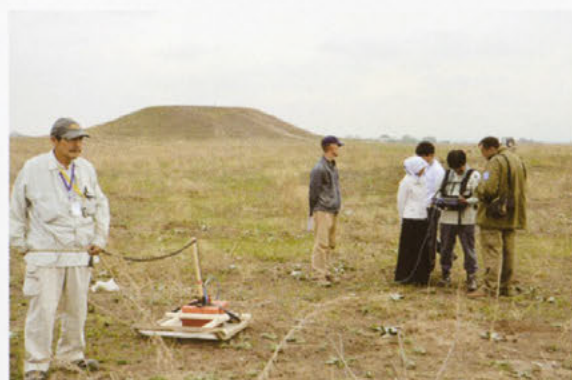
中央アジア（カザフスタン）での遺跡保存研修