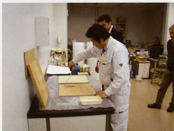
室内環境調査のための内装材料試験片作成