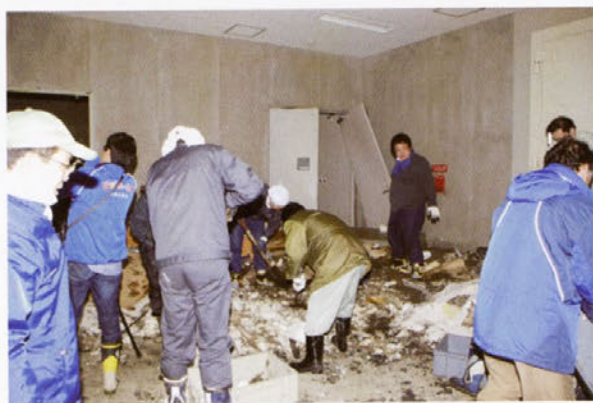
石巻文化センターにおける文化財レスキュー事業 (がれき除去)