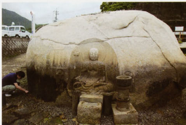
三原市・磨崖和靈石地藏の調査