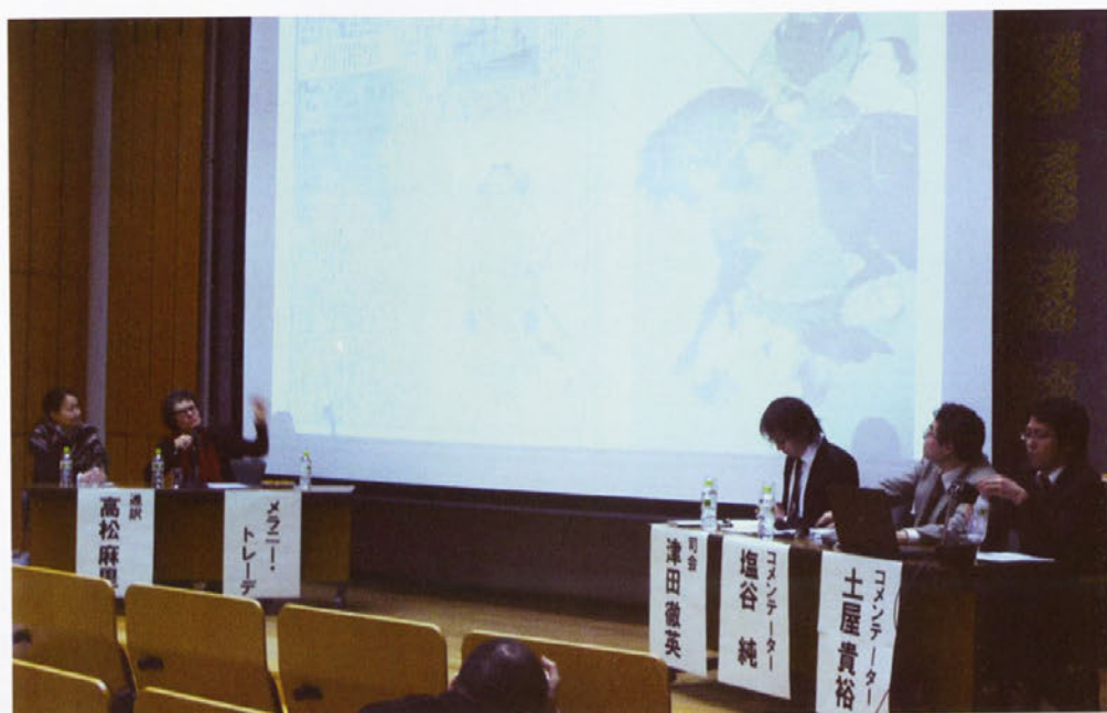
メラニー・トレーデ氏講演会「『文化的記憶』としての八幡縁起の絵画化—その古為今用」