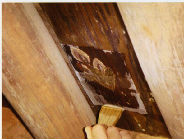
フノリを使った建造物彩色の表打ち作業