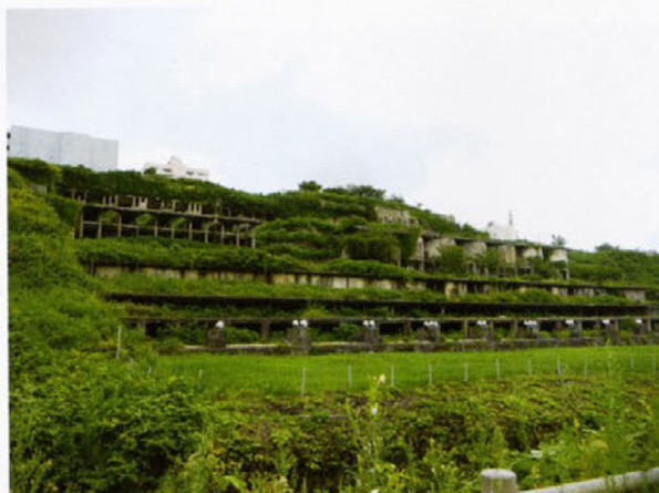
佐渡金銀山遺跡のコンクリート製浮遊選鉱場 (北沢地区)