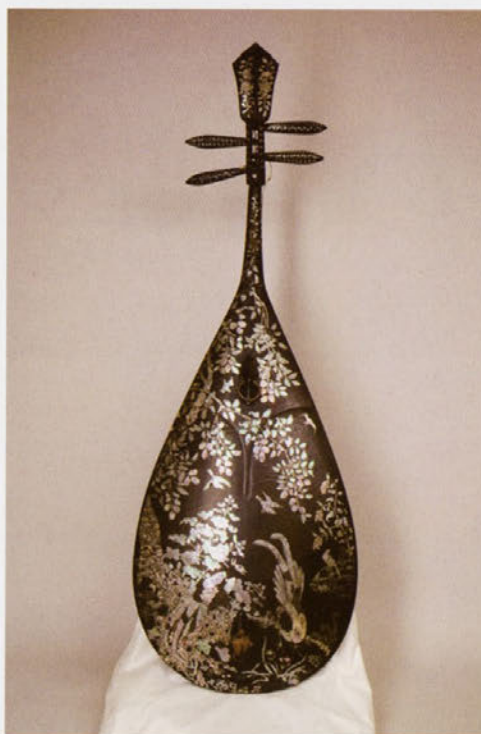
佐賀県立博物館新蔵資料 「花鳥螺鈿琵琶 銘『孝鳥絃』」