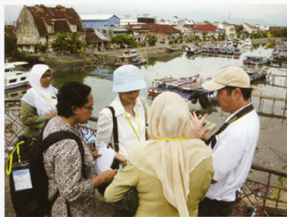
インドネシア・バタン被災町並み復興支援