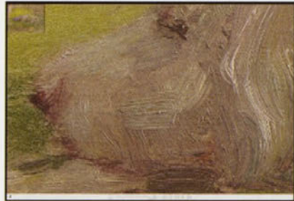
資料検索システムのトップページ

企画情報部では文化財の調査研究、保存活用に不可欠なアーカイブとして、文献資料と画像資料を収集・蓄積・整理・公開をしています。画像資料については、文化財アーカイブズ研究室の画像情報室で各研究部の依頼を受けて必要画像を作成するとともに、他機関との共同調査を行い、特殊撮影も含む画像資料を作成しています。文献資料は文化財アーカイブズ研究室の資料閲覧室で、収集・整理し、データベースを構築して閲覧の便宜を図るとともに、インターネットで公開しています。