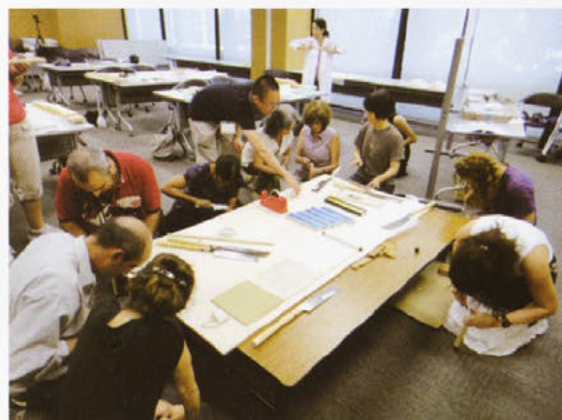
国際研修「紙の保存と修復」