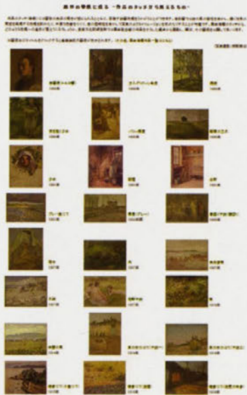
イメージギャラリー