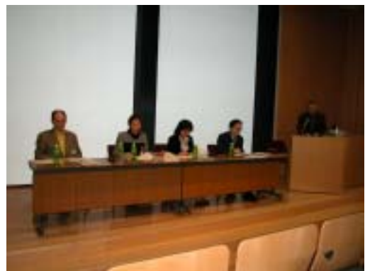
外来美術の受容 第2回ミニシンポジウム