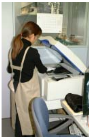
カラーポジ画像のスキャナー入力