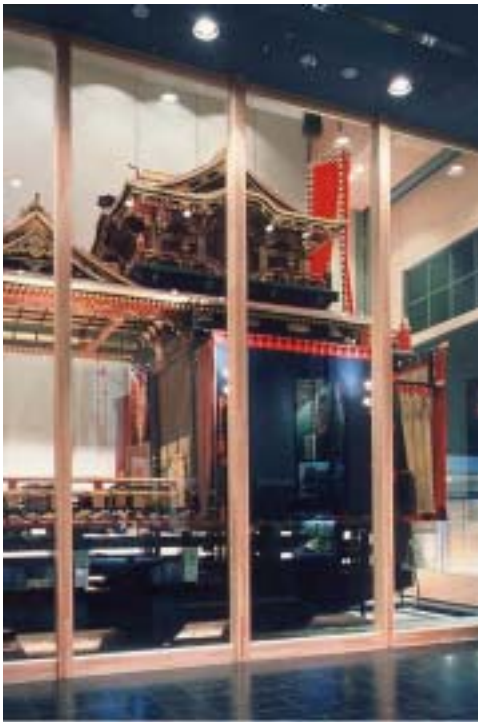
長浜市曳山博物館での曳山の展示