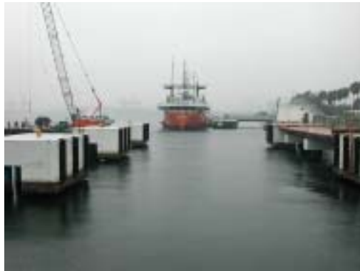
メンテナンスのために展示位置から移動した砕氷船「宗谷」(船の科学館)