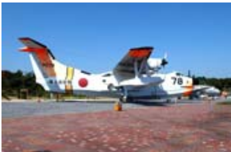
屋外展示環境の測定を行っているUS - 1A (かかみがはら航空宇宙博物館)