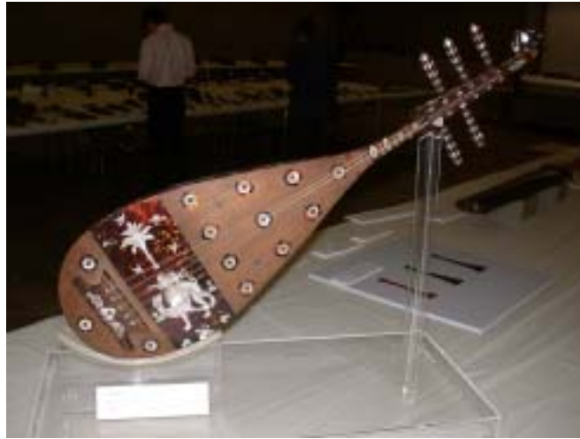
東京国立博物館蔵肝臟五弦琵琶（正倉院模造） 第 25 回文化財の保存及び修復に関する国際研究集会より