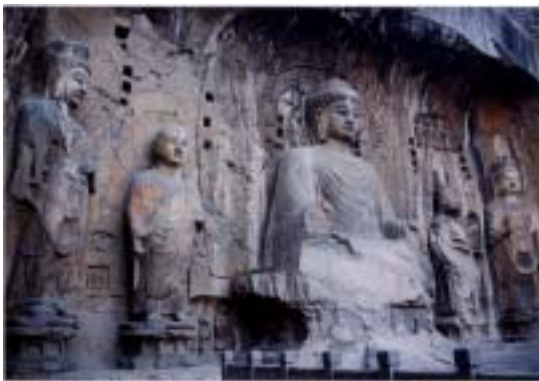
龍門石窟保存修復事業 奉先寺洞（7世紀）