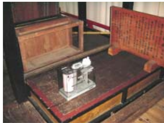
山蔵内の曳山舞台部分での温湿度測定の様子