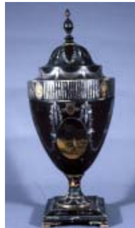
在外日本古美術品保存修復協力事業工芸品のクリーニング