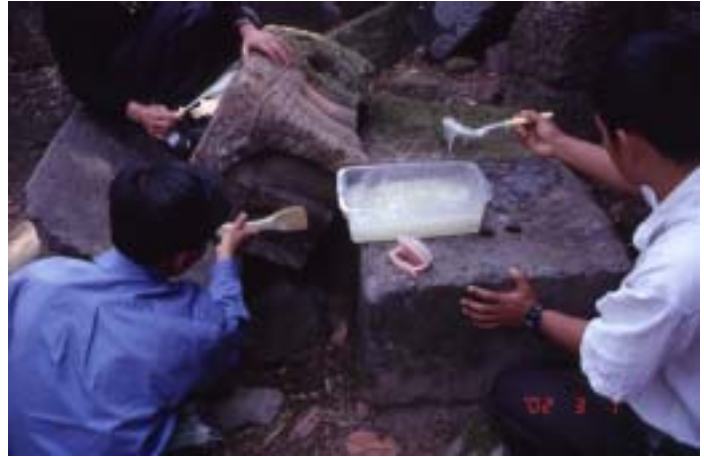
アンコールのタネイ遺跡における石材クリーニング実験