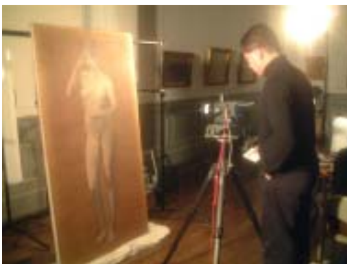
黒田清輝筆「智」調査風景