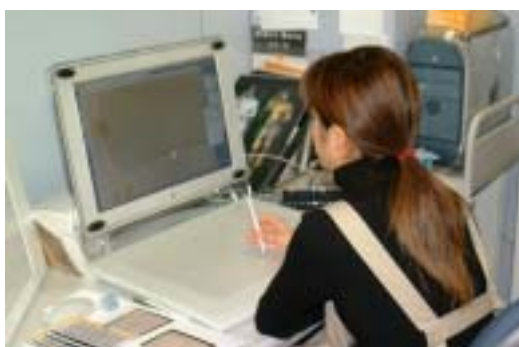
画像処理（画枠の決定・色調補正等）