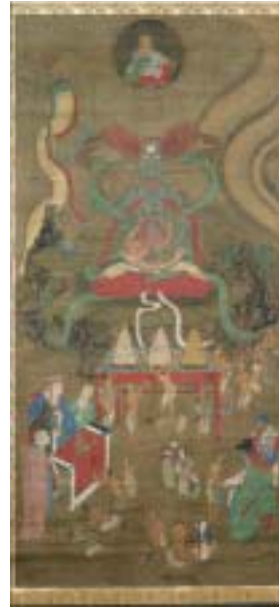
光学的手法による彩色の調査 千葉・観音教寺蔵 焰口餓鬼図