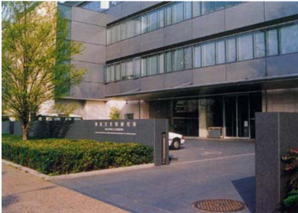
独立行政法人文化財研究所東京文化財研究所 平成 13 年 4 月 1 日設立