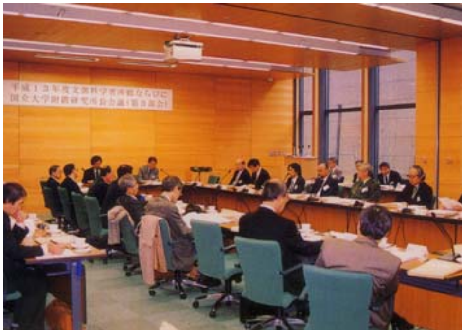
平成 13 年度文部科学省ならびに国立大学附置研究所長会議 (第 3 部会) 平成 13 年 11 月 30 日