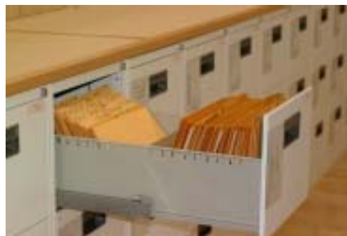
資料閲覧室における画像資料の配架

情報調整室では、画像形成のルーチーンを再検討し、フルカラー化と同時に適宜デジタル化を推進している。形成された画像は、イントラネット上の画像管理検索システムで管理し、資料閲覧室（2F）で公開している。