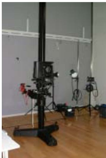
データ入力（写真撮影）