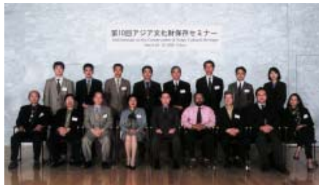
第10回アジア文化財保存セミナー