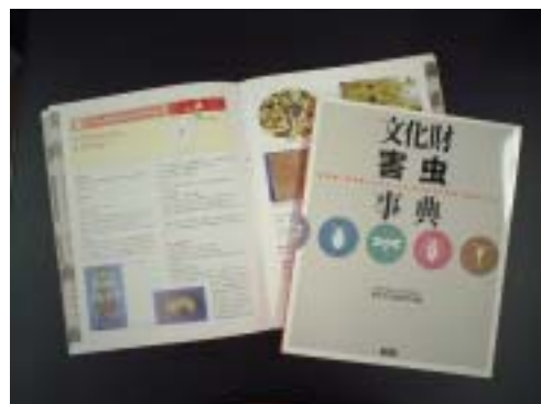
文化財に関する日本初の害虫事典（フルカラー、 主要な文化財害虫のカラーポスター付）