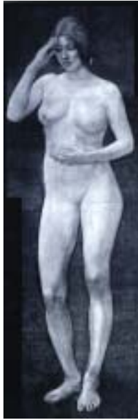
黒田清輝筆「智」反射近赤外線写真