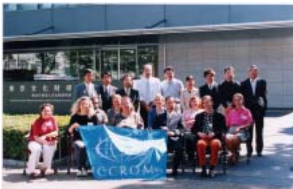
国際研修会「漆の保存と修復」