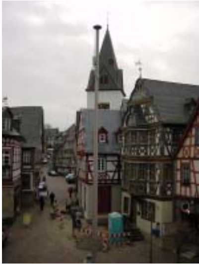
イドシュタイン（ドイツ） 景観保存の制度と実態を調査