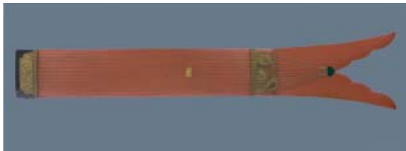
熱田神宮蔵鷄尾琴