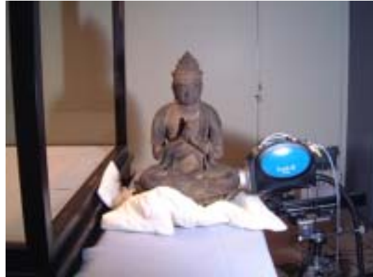
可搬型蛍光X線分析装置による国宝普賢菩薩騎象像の測定