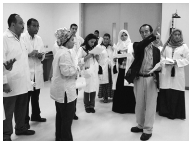
図3 文化財害虫について現場講習