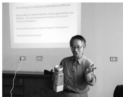
図8 空中浮遊菌の講義

第2回目の研修で、GEM-CC内での微生物モニタリングが重要であることが明らかになり、研修生達自らが微生物モニタリングできるようにプロジェクトの中で学ぶことが課題となった。そこで研修後の課題として、研修生に各ラボで月1回、空中菌の定点モニタリングを行っ