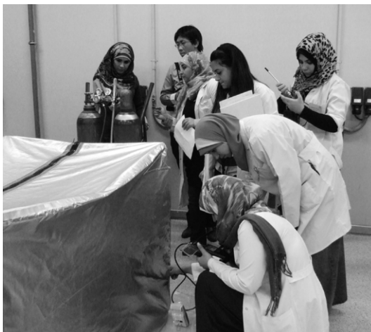
図7 ファスナーバッグを用いた炭酸ガス殺虫処理実習