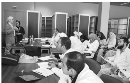
図2 研修初日の講義

GEM-CC の建物は南北に長い建物で、南北に走る2本の廊下で東西3つのブロックに分かれて各部屋が配置されている。建物前の施設内通路に面した西側のブロックがトラックヤードや事務室、会議室、図書室等があるエントランス区画で、中央のブロックが保存修復のための