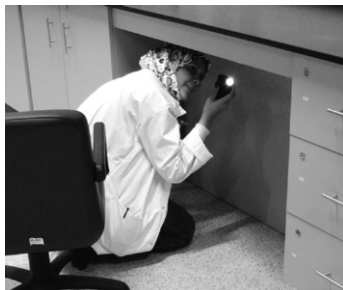
図5 保存修復ラボ内での害虫調査