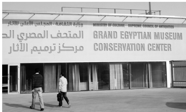
図1 GEM-CC 入口