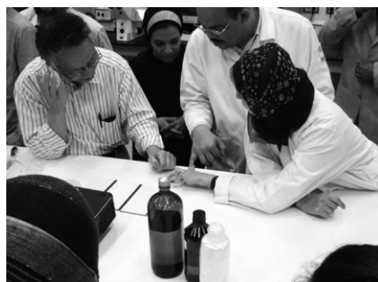
図9 空中浮遊菌の実習