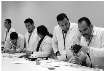
図6 回収したトラップの観察