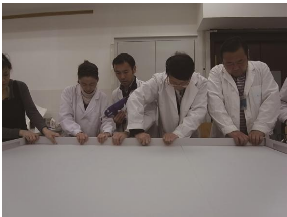
人材育成プログラム (中国・北京)