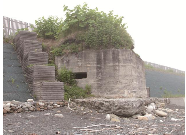
北海道帯広の海岸に残る太平洋戦争当時のコンクリート製トーチカ。現在は 波の浸食により徐々に海へ流されつつある。