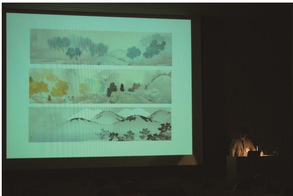
第43回オープンレクチャー