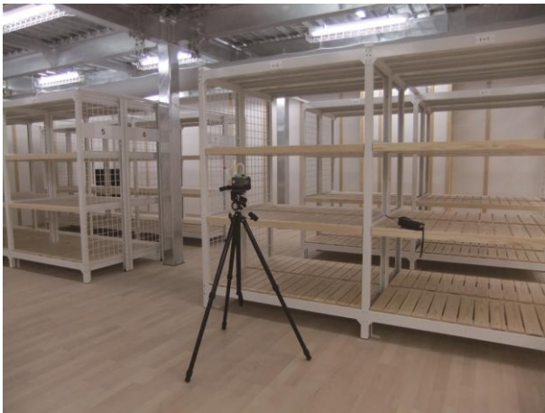
文化財施設の保存環境に関する研究