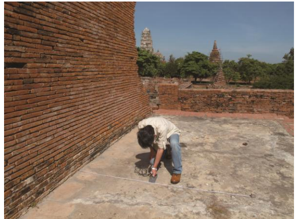
撥水処理効果の確認のための水分量の計測 (タイ・アユタヤ遺跡)