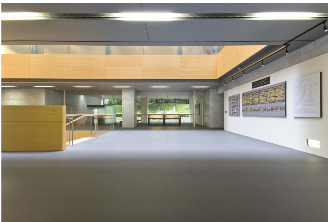
エントランス