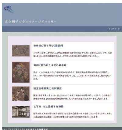
イメージギャラリー