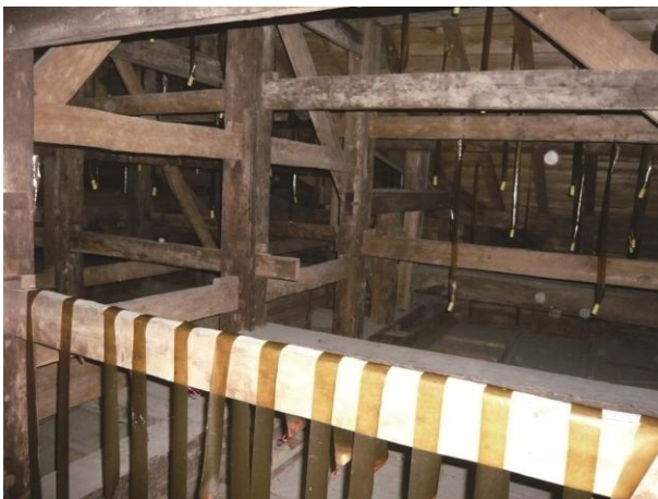
歴史的建造物における木材害虫の調査