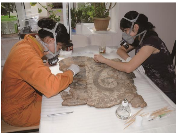
タジキスタンにおける保存修復専門家の育成