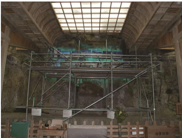
殺菌紫外線照射による 磨崖仏表面に着生する生物の除去