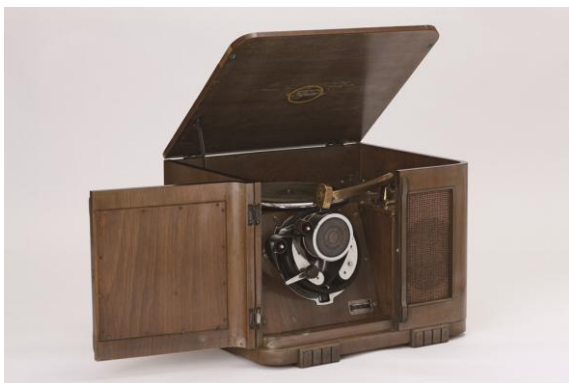
早稲田大学演劇博物館蔵フィルモン式再生機