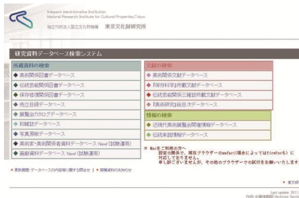
資料検索システムのトップページ

企画情報部では文化財の調査研究、保存活用に不可欠なアーカイブとして、文献資料と画像資料を収集・蓄積・整理・公開をしています。画像資料については、文化財アーカイブズ研究室の画像情報室で各研究部の依頼を受けて必要画像を作成するとともに、他機関との共同調査を行い、特殊撮影も含む画像資料を作成しています。文献資料は文化財アーカイブズ研究室の資料閲覧室で、収集・整理し、データベースを構築して閲覧の便宜を図るとともに、インターネットで公開しています。