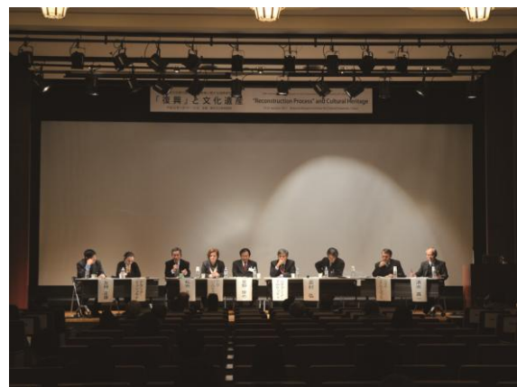
第34回文化財の保存および修復に関する国際研究集会 「復興」と文化遺産