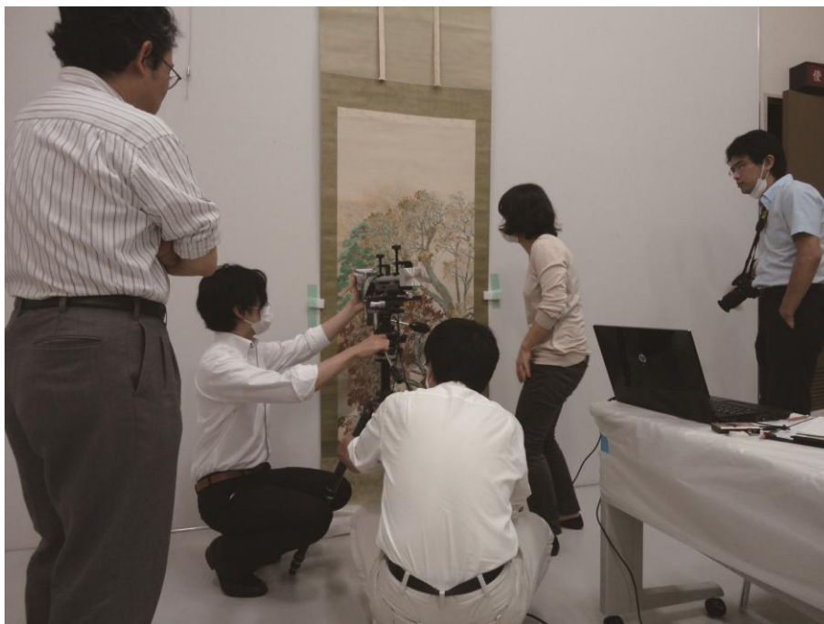
横山大観《山路》（永青文庫蔵）の調査