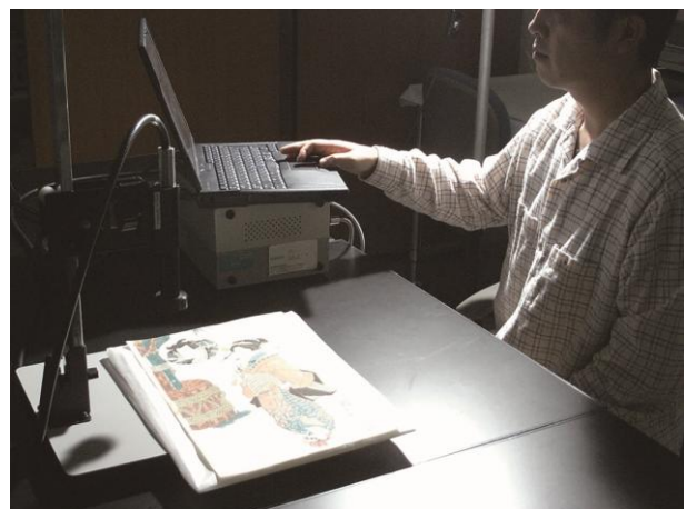
浮世絵彩色材料の可視反射分光分析