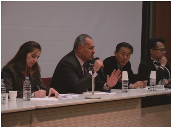
西アジアの文化遺産保護に関する会議