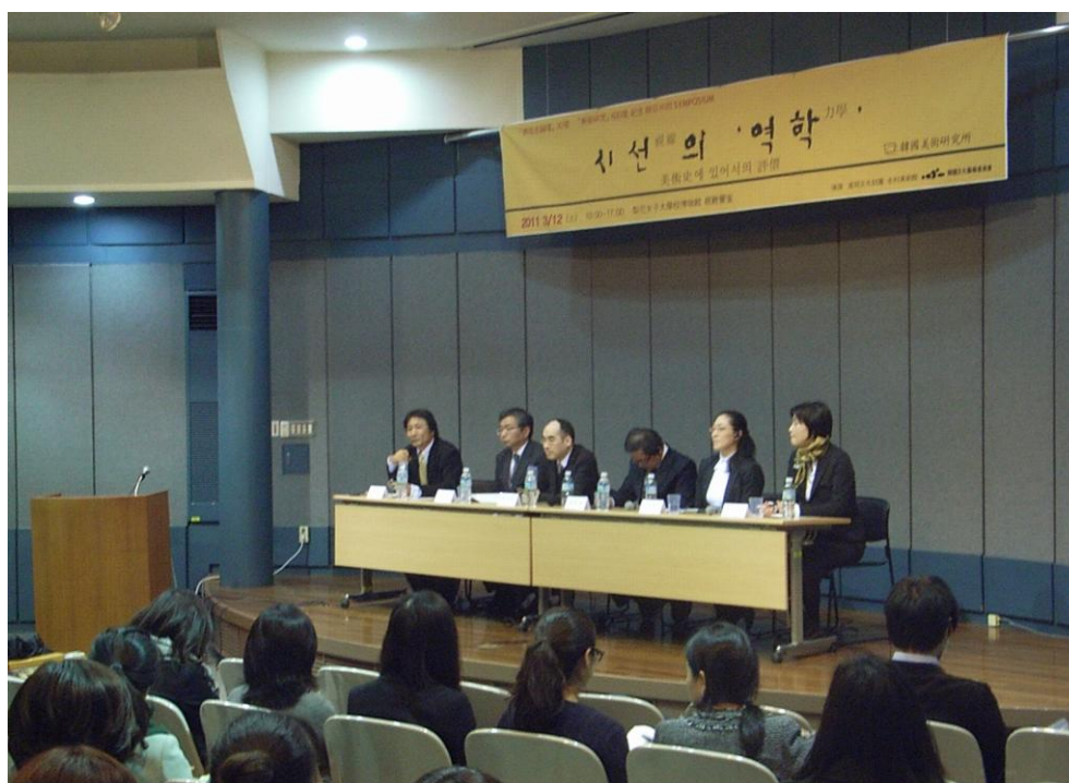
日韓共同シンポジウム「視線の『力学』—美術史における『評価』」 (会場：梨花女子大学、韓国ソウル市)