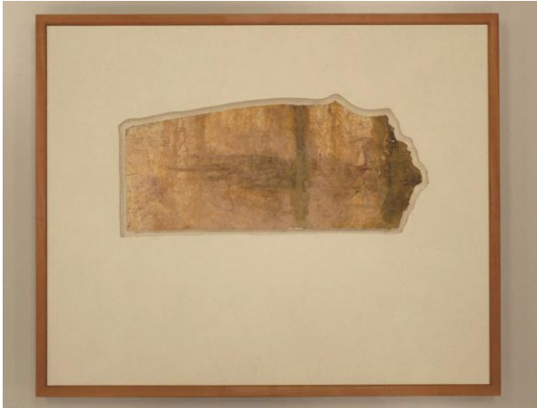
石室から取り外され仮処置が終了して 展示されたキトラ古墳壁画（朱雀）