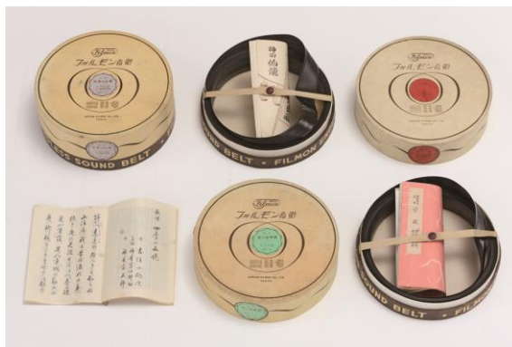
フィルモン音帯三種 長唄『四季の山姥』『汐汲』早稲田大学演劇博物館蔵 講談『越の海勇蔵』東京文化財研究所蔵