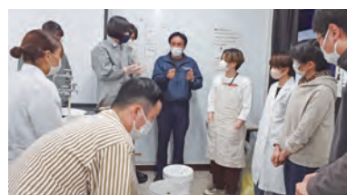
講義内容と、その時々々の社会情勢とを見極め、オンライン講義と対面講義とを併用して教育を進めました。(対面による演習風景)

TOBUNKEN has been providing a graduate course on preventive conservation in collaboration with the Tokyo University of the Arts since 1995. This course consists of two divisions: one concerning environmental influence on cultural properties and heritage, and the other concerning conservation materials. Six members of TOBUNKEN participate as adjunct professors in the program.