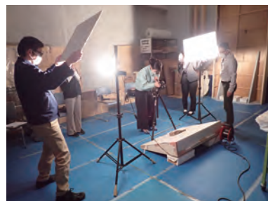
写真撮影に関する実習 Hands-on workshop on photographing

This seminar is primarily for municipality officers and museum staff about inventorying, photographing and data management of their cultural properties. The aim of the seminar is to enable the participants to appropriately acquire and manage information of their cultural properties for conservation and utilization. This fiscal year, lectures as well as reach out workshops in hands-on modality on this topic are planned.