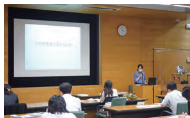
修復材料の種類と特性についての講義 Lecture on the types and characteristics of restoration materials

This course is aimed at providing training to museum curators in charge of conservation of their materials. Through this program, they can acquire knowledge and skills required for conserving cultural properties and gain a scientific understanding of cultural properties, primarily based on the knowledge of the natural sciences. Participants are being invited through the boards of education of prefectures and ordinance-designated cities, and the course is scheduled to be held from July 4th to 8th, 2022.