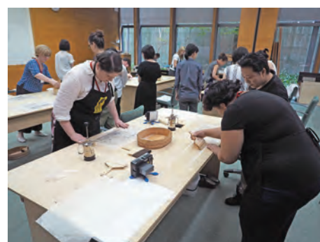
国際研修「紙の保存と修復」

In the implementation of international cooperation projects spanning a wide range of subjects, the Center collaborates actively with external institutions of related fields. One such example is the international training course for the conservation and restoration of paper cultural properties (International Course on Conservation of Japanese Paper), which is jointly held with the International Centre for the Study of the Preservation and Restoration of Cultural Property (ICCRUM). As for projects related to the conservation and restoration of archaeological and architectural heritage, the Center has been participating, directly or in the form of technical collaboration, in the UNESCO/Japan Funds-in-Trust projects. Examples of such projects include cooperation projects with UNESCO in Afghanistan, Central Asia, Vietnam, Myanmar and Nepal as well as projects in collaboration with the Japan International Cooperation Agency (JICA).