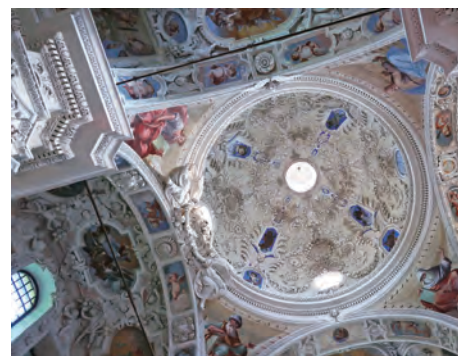
バロック時代のスタッコ装飾に係る調査(スイス・ルガーノ)

This project aims to build a network linking experts in Japan and research institutes in other countries, as well as conduct underlying research on the latest trends in conservation and restoration techniques, focusing on immovable cultural properties such as wall paintings. We further aim to apply the results achieved to the field of international collaboration in cultural heritage, as well as contribute toward the development of conservation and restoration techniques in related fields in Japan and other countries.