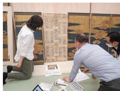
作品修復中の調査検討(モントリオール美術館所蔵作品)

Many Japanese cultural properties are housed in collections overseas, especially in the West. However, the number of conservators and restorers outside Japan who are able to work on those objects is small. Therefore, conservation treatments cannot be done using appropriate methods at the right moment. The absence of such conservation means that the objects cannot be exhibited and that damage may become extremely severe. In this program, paper or silk cultural properties, such as hanging scrolls, that have been housed in collections overseas are restored.