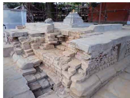
シヴァ寺の震災復旧に向けた基壇の部分解体調査 (カトマンズ・ネパール)

The Asian region, which has a close cultural exchange with Japan, is rich in precious cultural heritage. However, not a few of the countries there still have problems with their systems for the preservation of cultural heritage and/or appropriate technology level. How to protect cultural heritage from deteriorating environmental factors and pressures of development as well as conflicts and natural disasters is a common issue of the world. TOBUNKEN, therefore, contributes to improving systems for the protection of cultural heritage and transfer of relevant technologies through technical assistance and research studies in terms of conservation, restoration, management, and utilization of cultural heritage in different countries. It is developing multifaceted cooperative activities of various types and methodologies in response to the needs of the object country. These include such technical cooperation projects targeting specific monuments or sites as assistance for the conservation and sustainable development of the Ta Nei temple in Cambodia, technical assistance for the protection of cultural heritage damaged by the earthquake in Nepal, joint survey for conservation and utilization of historic buildings in Bhutan, as well as collaboration with externally funded cooperation projects for Iran and Syria.