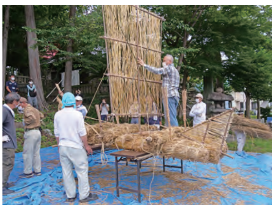
北田の天王舟流し行事(静岡県静岡市) Kitada event of Tennoh Ship (Shizuoka City, Shizuoka Prefecture)

Furthermore, we endeavor to pursue a nation-wide database and archive data portal, including video documentation.