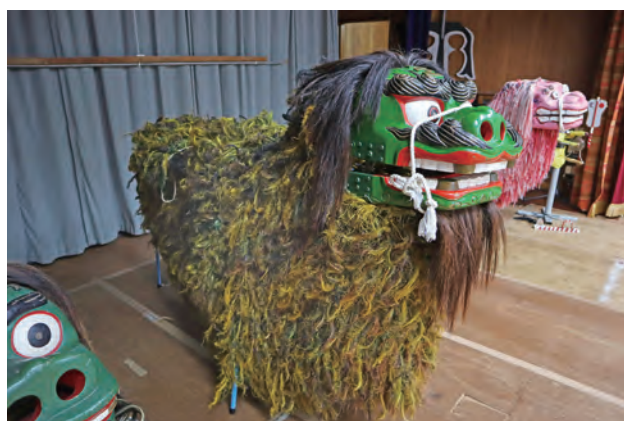
志多伯の獅子舞用具(沖縄県八重瀬町) Lion Dance equipment of Shitahaku (Yaese Cho, Okinawa Prefecture)