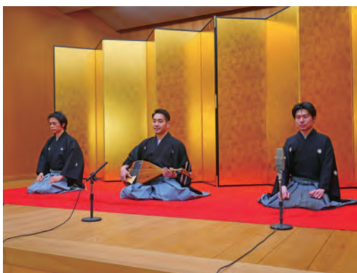
実演記録「平家」第四回の収録 Recording of the live performance of Heike the fourth