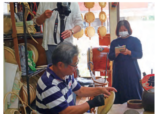
伝統楽器(大鼓の革)の製作技術の調査(令和3(2021)年)

To protect cultural properties, we must preserve and share techniques to conserve and restore cultural properties and to produce materials and tools for the restoration, in addition to the cultural properties themselves. The Department investigates traditional techniques that are indispensable in conserving cultural properties; for example, the research on the techniques for production and restoration of musical instruments and costumes vital for traditional performing arts.