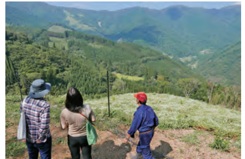
韓国国立無形遺産院との研究交流における焼畑農耕技術の調査 (宮崎県椎葉村、令和2(2019)年)

The Department undertakes research exchange, international cooperation and data collection to safeguard intangible cultural heritage in collaboration with related organizations in other countries. Through the ongoing research exchange with the National Intangible Heritage Center in the Republic of Korea since 2008, the Department has promoted personnel interchange and organized joint study groups. The Department conducts its projects in cooperation with the International Research Centre for Intangible Cultural Heritage in the Asia-Pacific Region (IRCI). Furthermore, the Department staff attend the Intergovernmental Committee for the Convention for the Safeguarding of the Intangible Cultural Heritage of UNESCO to collect information about the current status of safeguarding intangible cultural heritage in other countries. In FY 2021, the COVID-19 pandemic caused difficulties in conducting international academic exchanges. However, we continued our projects by attending online conferences.