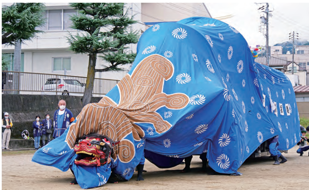
新型コロナウイルスの感染状況が落ち着いた際に催行された「南信州獅子舞フェスティバル」(令和3(2021)年10月)。 “Minami Shinshu Shishimai (lion dance) Festival” was held when the pandemic was mild in October 2021.

Audio-Visual Documentation Section conducts research on methods of documentation and archiving. It also documents intangible cultural properties, intangible folk cultural properties and conservation techniques for cultural properties in order to understand their present conditions and to transmit them to future generations.