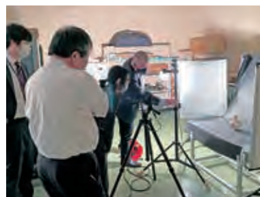
写真撮影に関する実習 Hands-on workshop on photographing

This seminar is primarily for municipality officers and museum staff about inventorying, photographing and database compilation of their cultural properties. The aim of the seminar is to enable the participants to appropriately acquire and manage information of their cultural properties for conservation and utilization. This fiscal year, lectures as well as hands-on workshops on this topic are planned.