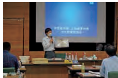
生物被害対策に関する講義 Lecture on measures against biodeterioration

This course is aimed at providing training to museum curators in charge of conservation of their materials. Through this program, they can acquire knowledge and skills required for conserving cultural properties and gain a scientific understanding of cultural properties, primarily based on the knowledge of the natural sciences. Participants are being invited through the boards of education of prefectures and ordinance-designated cities, and the advanced course is scheduled to be held from July 5 to 9, 2021.