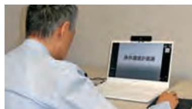
コロナ禍で緊急事態宣言中は、講義は主として研究所内に設けられたブースからオンラインで発信されました。 Online lectures were performed from a booth in the Institute under the state of emergency caused by the new coronavirus infectious disease (COVID-19).

The Institute has been providing a graduate course on preventive conservation in collaboration with the Tokyo University of the Arts since 1995. This course consists of two divisions: one concerning environmental influence on cultural properties and heritage, and the other concerning conservation materials. Six members of the Institute participate as adjunct professors in the program.