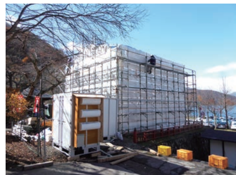
中禅寺愛染堂での加湿温風殺虫処理の現地試験の様子 Field test of humidity-controlled warm air treatment for wooden historical building (Aizendo, Chuzenji Temple)

In cultural property conservation, there are a lot of examples of severe damage by means of biological deterioration. The growth of organisms on cultural properties is promoted by some factors provided from daily managements or occasionally natural disaster. These factors are related to environments surrounding the cultural properties complicatedly. The Biological Section studies effective countermeasures against bio-deterioration of cultural properties through the researches of interaction between organism and environment surrounding the cultural properties. Currently, this Section is focusing ecological characteristics of algae communities colonized on the surface of a stone coffin, a simple and rapid method for measuring microorganisms, an insecticidal treatment reducing an environmental load for historical wooden buildings, and a cleaning technique using newly developed enzyme on fungal-damaged cultural properties.