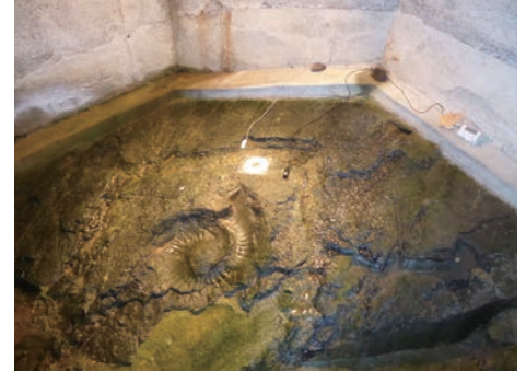
化石を現地で露出展示する「アンモナイト館」における環境計測（熊本県・天草市） Measurement of environmental condition of the "Ammonite House", where the fossil is exposed for exhibition in situ (Amakusa City, Kumamoto Prefecture)

Degradation of outdoor cultural properties is strongly affected by ambient surroundings. For example, freeze degradation can be a big threat to the monuments in cold districts and there is a fear of damage by tsunami or flood on sites located in low land. This study is aiming at the establishment of the methods to suppress degradation progression of monuments due to environmental factors by conducting environmental measurement as well as experimental methods.