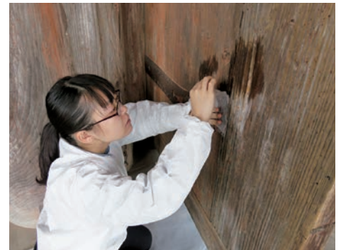
ゲルを使用した油污損被害のクリーニング Cleaning of oil-like stains on historical architecture by the gel cleaning method, which was developed in this project

Appropriate selection of materials and techniques has an effect on the condition of the original after restoration treatment. This study aims to analyze and evaluate traditional materials and techniques for selecting suitable treatment. In addition, we aim to develop new materials and techniques in case of difficult to apply conventional treatments.