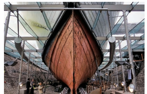
温湿度制御下におけるSS Great Britain号(英国ブリストル市)の展示状況 Exhibition of SS Great Britain under temperature and humidity control (Bristol, England)

Modern cultural heritage, such as factories, bridges, aircraft and rolling stock, is large in scale and composed of a wide range of materials. Research is conducted concerning plans and methods for the conservation of such cultural heritage by collecting information as well as investigating and developing conservation techniques and materials so that it may be passed down to the next generation. A research on the conservation and restoration of iron structures was done in 2017. We will conduct a research on the preservation and restoration of concrete structures and buildings in 2018.