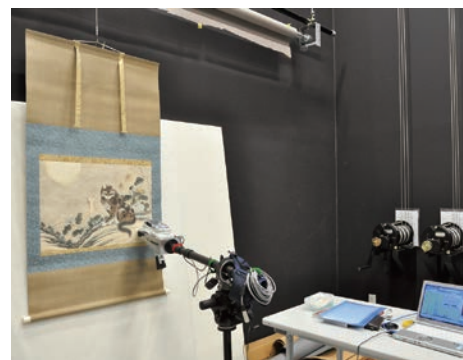
可搬型蛍光X線分析装置を用いた絵画の彩色材料調査 Investigation of colorants of a painting using portable X-ray fluorescence spectrometer

Various non-destructive analytical methods are applied to investigate materials, structures and conditions of cultural properties. In particular, on-site analyses using portable instruments are encouraged: X-ray fluorescence spectrometry and X-ray diffractometry for analysis of inorganic substances, FT-IR and visible reflection spectrometry for identification of organic compounds and X-ray radiography for investigation of internal structure. Analytical data obtained from these investigations are organized and made available to the public.