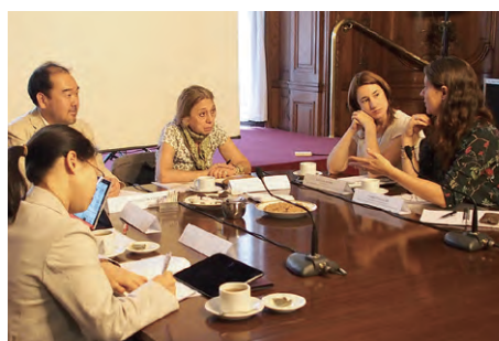
アルゼンチン文化省との協力に関する協議 Discussion on cooperation with the Ministry of Culture, Argentina