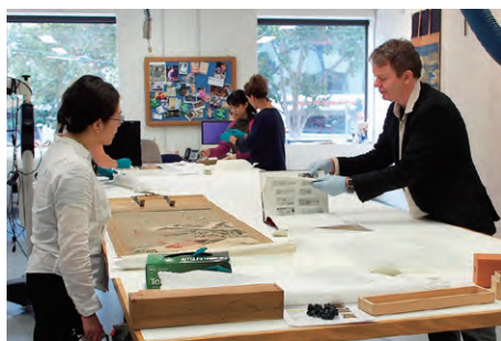
ヴィクトリア国立美術館における調査(オーストラリア) A survey at the National Gallery of Victoria