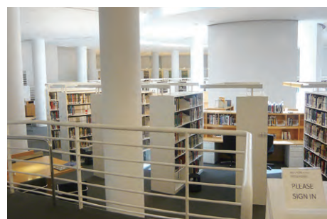
ゲッティ研究所のライブラリー(アメリカ) The library of the Getty Research Institute

在外日本古美術品保存修復事業 The Cooperative Program for the Conservation of Japanese Art Objects Overseas (2015-)