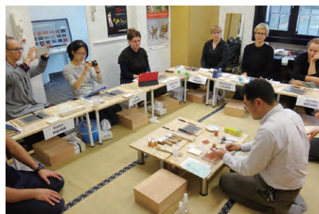
ケルンワークショップ「漆工品の保存と修復」(ドイツ) Workshops on the Conservation and Restoration of Urushi (Japanese Lacquer) Ware