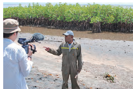
気候変動が文化遺産に及ぼす影響に関する調査(フィジー) Survey of cultural heritage that is likely to be affected by climate change (Republic of Fiji)

当研究所は世界の専門機関、専門家とも交流を図っています。調査研究、修復事業、人材育成などを通じ、アジアを中心とする各国の文化財保護に貢献しています。