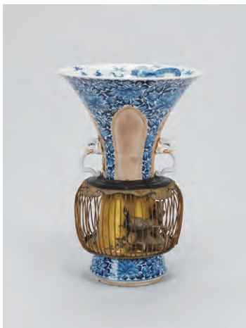
ドレスデン国立美術館陶磁器資料館所蔵 染付時絵鳥籠装飾広口大瓶(登録番号PO 5178) Bird Cage Vase, Porzellansammlung, Staatliche Kunstsammlungen Dresden (Porcelain Collection, Dresden State Art Collection, Inventory No. PO 5178)