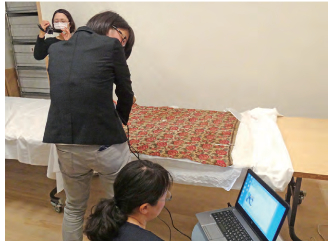
文化学園服飾博物館における勉強会 Study seminar in the Bunka Gakuen Costume Museum

The Department of Intangible Cultural Heritage and the Center for Conservation Science began basic research and study on techniques and materials associated with textiles from fiscal year 2014 with the cooperation of the Bunka Gakuen Costume Museum and the Division of Textile Arts, Faculty of Fine Arts, Tokyo University of the Arts. The project aims to clarify the techniques and materials of textiles by collecting and organizing basic information from documentary records as well as to promote organization of information on scientific research and study of textiles.