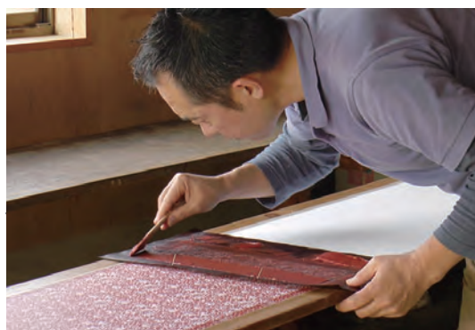
染織技術調査 Investigation of dyeing techniques

先人たちが築き伝えてきた文化財は、現在を生きる人々にとって精神的な支柱になるばかりか文化芸術活動の規範ともなる重要な意味を持っています。文化財は決して過去の遺物ではありません。私たちの生活を豊かにする源になるものというべきものです。近年、各地で地域に密着した文化財を掘り起こし日常生活の中でこれを積極的に活用していこうとする試みがなされています。こうした活動の多くは地域おこしの一環として自発的にはじめられたものですが、とりわけ文化財を中心に保存継承さらには発展する地域活動に身を投じる人々にとって、文化財は今を生きる自らの立ち位置を確認し、地域で生きていく喜びや自信にもつながる源ともなっています。