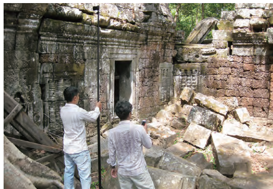
コンパクトカメラとスマートフォンによる3Dデータ作成写真測量 (カンボジア・タネイ寺院) Photogrammetric survey with a compact camera and a smartphone for producing 3D data (Ta Nei temple, Cambodia)