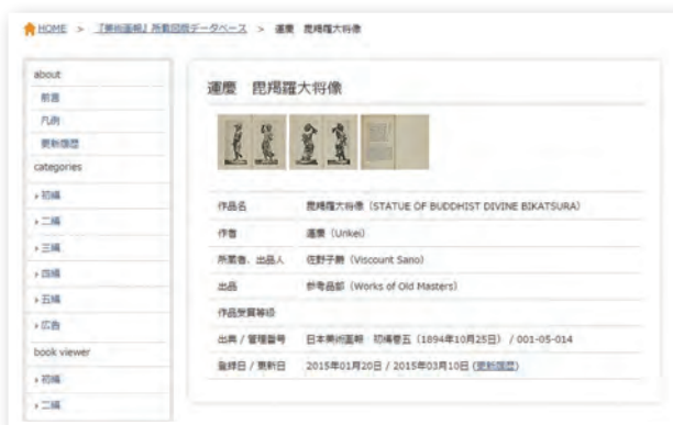
『美術画報』データベース、運慶作毘羯羅大菩薩の検索結果 Result of a search for data on Statue of Buddhist Divine Bikatsura by Unkei in the Bijutsu Gaho Database

Bijutsu Gaho (The Magazine of Art) (see p.4) began as an art magazine entitled Nihon Bijutsu Gaho , founded by Gahosha in June 1894. In addition to publishing images of new works by artists of the day, the magazine also published reference works consisting of art and decorative artworks from the Edo and earlier periods. Thus the journal is a valuable resource on what the Meiji period considered to be classics from earlier periods. The name was changed to Bijutsu Gaho in 1899 and publication continued until the end of the Taisho period. The Department is currently creating a searchable database of the names of artists and titles of works illustrated in both Nihon Bijutsu Gaho and Bijutsu Gaho . Contents of the database will be updated on the Institute's website.