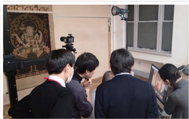
国宝・孔雀明王像(東京国立博物館蔵)の調査 Examining the National Treasure, Mahamayurividyarajni (Jpn: Kujaku Myo-o), Tokyo National Museum

Japanese Buddhist painting reached the zenith of finely detailed beauty during the 12th century (Heian period). Yet the fine details of its extremely intricate painting techniques are difficult to see with the naked eye. The Department photographed the Heian period Buddhist paintings in the collection of the Tokyo National Museum with the Institute's high-resolution digital equipment. The images produced for this joint research project with the Tokyo National Museum allow for a detailed view of the minute techniques used and an understanding of how those techniques relate to the expressiveness of the paintings.