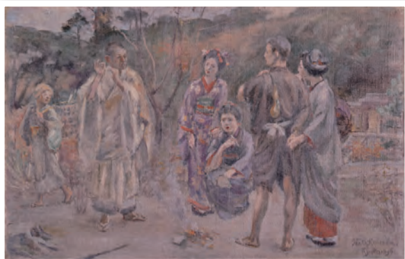
黒田清輝《昔語り下絵(構図Ⅱ)》 1896年 東京国立博物館蔵 KURODA Seiki, Study for Talk on Ancient Romance (Compositional study II), 1896, Tokyo National Museum

今回の黒田清輝展では黒田の作品とともに、バルビゾン派や印象派の作品等、国内外の美術館が所蔵するフランス絵画もあわせて展示します。黒田の留学時期にあたる19世紀後半のフランス絵画の流れの中に位置づけることで、黒田がそこからどのような要素を汲みとり、日本にもたらそうとしたのかを検証します。