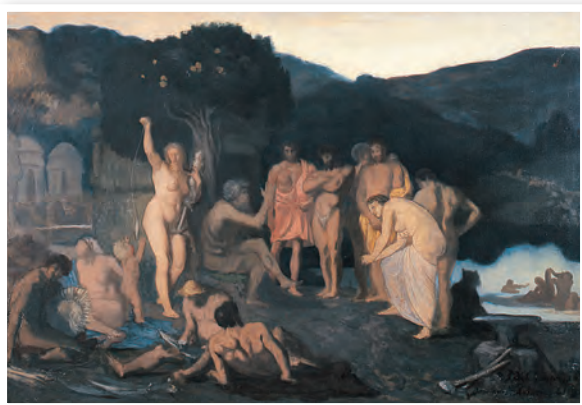
ピュヴィス・ド・シャヴァンヌ《休息》 1861年 島根県立美術館蔵 Puvis de Chavannes, Rest , 1861, Shimane Art Museum, Matsue

Talk on Ancient Romance was KURODA's experiment at creating a large-format composition of a group of figures, a compositional form and subject matter then in the mainstream of the French Salon exhibitions. The work was destroyed in World War II, but this study allows an understanding of its overall composition and palette. Individual charcoal sketches and oil studies remain for each of the figures depicted.