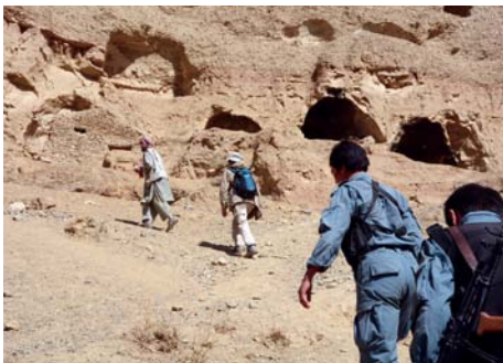
バミヤーン遺跡での石窟調査(アフガニスタン) Survey of caves in the Bamiyan Valley in Afghanistan

文明発祥の地、そしてシルクロード東西交流の舞台として西アジア諸国が歴史上果たしてきた役割は限りなく重要なものです。本事業は西アジア諸国を中心とする文化遺産の保護・保存修復に関する協力と支援を目的としています。特に紛争のために危機に瀕するアフガニスタンやイラクの文化遺産の保護と調査研究あるいは現地専門家の人材育成や技術移転に取り組んでいます。また、現在内戦状態に陥っているシリアの文化遺産を守るべく紛争終結後に向けた取り組みも開始しました。本事業の活動地域は西アジアにとどまることなく、中央アジア諸国、コーカサスなどの周辺地域でもユネスコや各国の関係機関と協力して、様々な文化遺産の保護活動を実施しています。