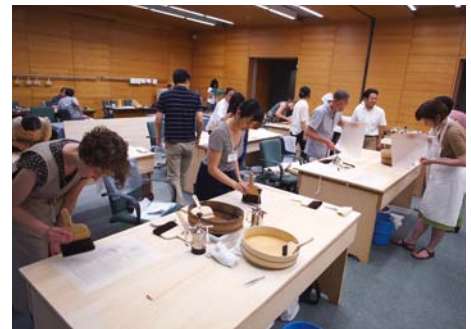
国際研修「紙の保存と修復」 "International Course on Conservation of Japanese Paper"