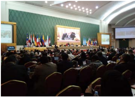
フノンペンで開催された第37回世界遺産委員会 37th session of the World Heritage Committee held in Phnom Penh

文化財の保護制度や施策に関する諸外国や国際機関の動向についての情報収集と分析は、わが国の文化財保護制度の将来を考える上でも、また日本が文化財保護の分野で国際協力を行っていく上でも重要です。また、各国の専門家・機関と協力してシンポジウム等を開催することを通じて、情報交換の活発化とともに、国際協力のネットワークを広げていくことを目指しています。