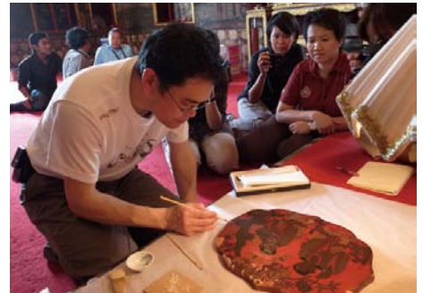
バンコクのラチャプラディット寺院における螺鈿装飾扉の調査(タイ) Study of old door panels decorated with mother-of-pearl inlay technique at Wat Ratchapradit, Bangkok, Thailand

Southeast Asian countries, which have close historical and cultural relationship with Japan, are in different stages of establishing systems for the preservation of cultural heritage but share common issues in protecting it from such matters as environmental factors and pressures of development. The Institute cooperates with the Fine Arts Department of the Thai Ministry of Culture on the conservation of cultural heritage. In Cambodia, succeeding and further developing the results of cooperation conducted so far, such as the joint research on microbiological deterioration and the training program on architectural measurement, the Institute is about to start providing assistance in formulating a plan for the conservation project of Ta Nei temple by the APSARA National Authority. In Myanmar, in coordination with external fund projects, the Institute is cooperating in the conservation of historical wooden buildings and mural paintings, as well as arts and crafts, by conducting joint researches and holding seminars.