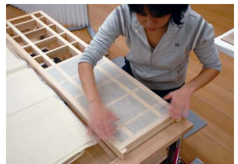
下地作製 Wooden lattice core

Many Japanese cultural properties are housed in collections overseas, especially in the West. However, the number of conservators and restorers outside Japan who are able to work on those objects is small. Therefore, conservation treatments cannot be done by proper methods at the right moment. The absence of proper conservation treatments means that the objects cannot be exhibited and that damage may become extremely severe. In this program, paper or silk cultural properties, such as hanging scrolls and urushi (Japanese lacquer) ware, that have been housed in collections overseas are restored.