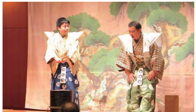
山口鷺流狂言保存会による実演「不毒」 The program "Busu" performed by the Preservation Society for Yamaguchi Sagi School of kyogen