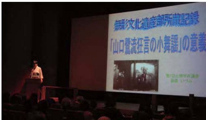
2012年度 公開講座「山口鷺流狂言の伝承を考える—東京文化財研究所無形文化遺産部所蔵記録をめぐって—」 7th Public Lecture "Carrying on Yamaguchi Sagi School of kyogen : Recordings in the Department of Intangible Cultural Heritage," 2012

A public lecture is held every year to present the results of research conducted by the Department of Intangible Cultural Heritage. The 8th Lecture will be held on October 5th, with the "story tellers' theater" as its theme.