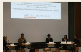
ARLISシンポジウムの開催 International Symposium: Art Libraries Society of North America (ARLIS/NA) Commemoration of visit to Japan