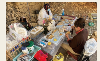
ルクソール(エジプト)での断片壁画の保存修復に向けた技術協力 Technical cooperation for the conservation and restoration of mural painting fragments in rock-cut tomb at Luxor, Egypt

当研究所は世界の専門機関、専門家とも交流を図っています。調査研究、修復事業、人材育成などを通じ、アジアを中心とする各国の文化財保護に貢献しています。