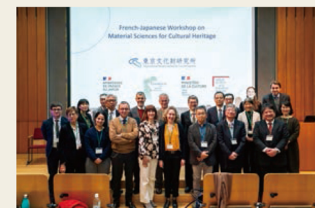
文化財科学に関する日仏ワークショップ(東京文化財研究所、令和6(2024)年3月) French-Japanese Workshop on Material Science for Cultural Heritage, at TOBUNKEN, March 2024