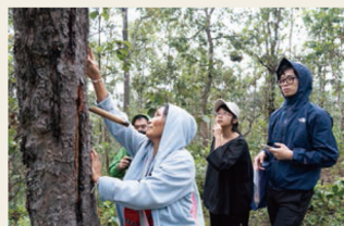
カレン民族による漆収集の調査(タイ) Observation of lacquer harvesting by Karen community, Thailand