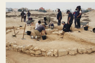
バーレーン、アアリ古墳群西の発掘調査 Excavations at A'ali West Burial Mounds, Bahrain