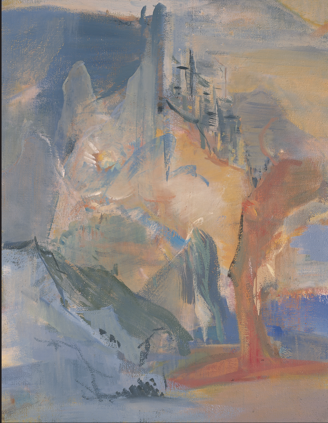
イケムラレイコ「マロヤ湖のスキーヤー」（豊田市美術館蔵） Leiko Ikemura, Skier on Maloja Lake , Toyota Municipal Museum of Art

The 37 th International Symposium on the Conservation and Restoration of Cultural Property