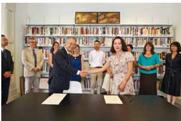
セインズベリー日本藝術研究所との共同事業協定書調印式