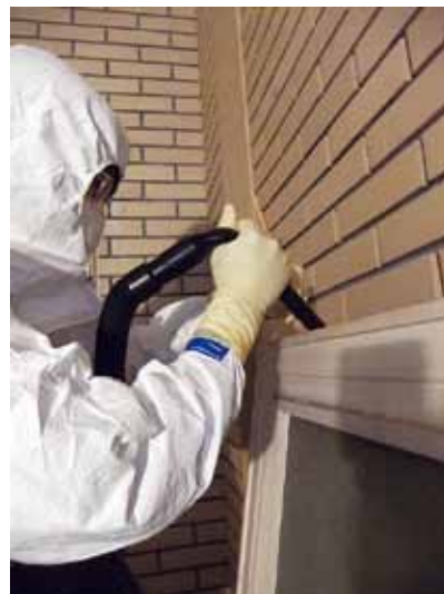
文化財の除染に関する実地試験