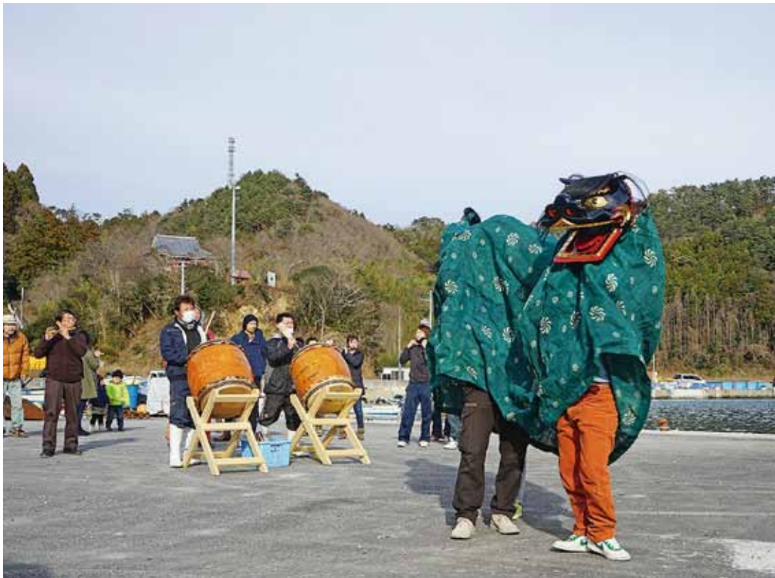
宮城県女川町における被災地芸能調査