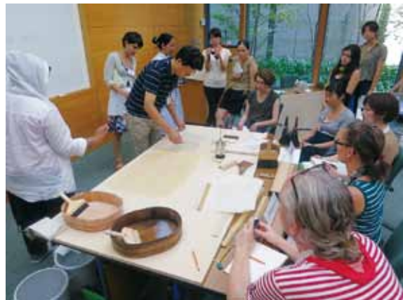
「紙の保存と修復」の研修風景