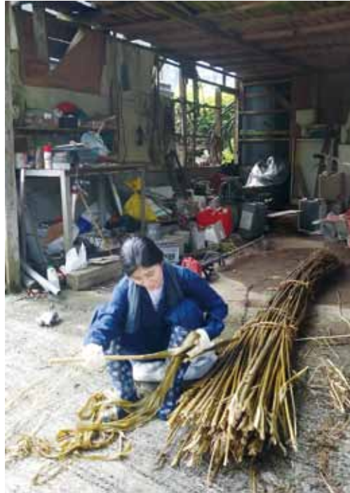
粗苧製造のための大麻の皮剥ぎ