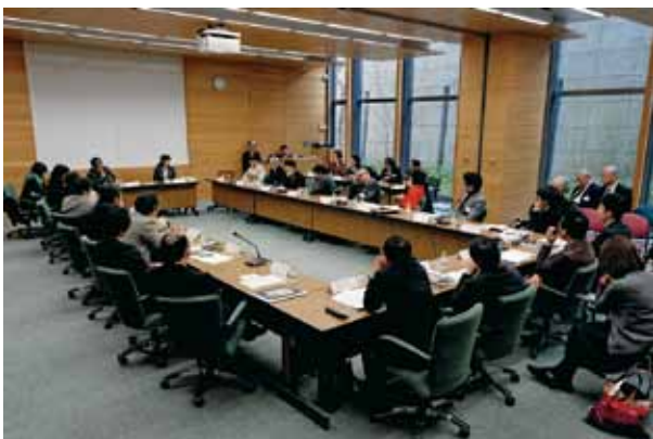
国際シンポジウム ラウンド・テーブル（総合討論）