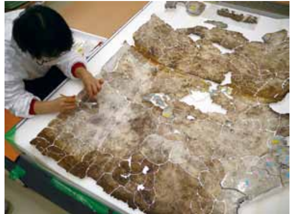
キトラ古墳天井 取り外した漆喰片の再構成作業