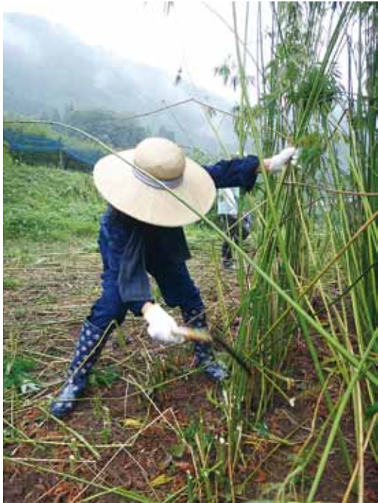
粗苧製造のための大麻の刈り取り