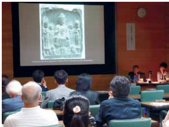
スタンレー・アベ氏講演会