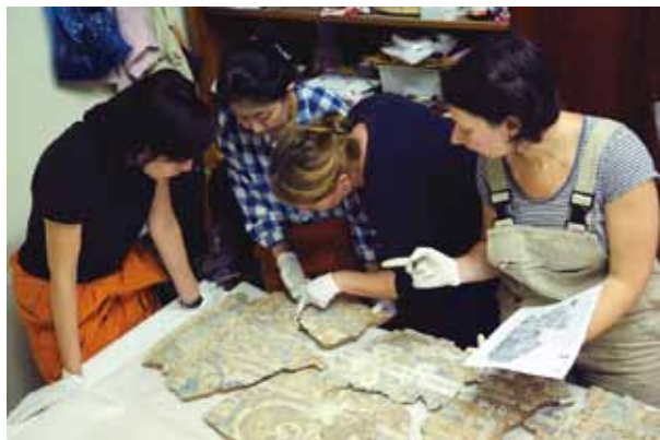
タジキスタンにおける壁画の保存修復