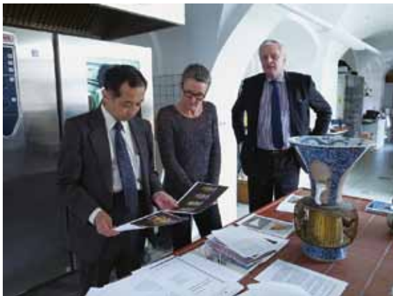
ドレスデン美術館所蔵陶磁器コレクションの調査 (ツウインガー宮殿内)