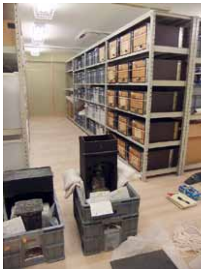
仮保管庫での収納環境の調査