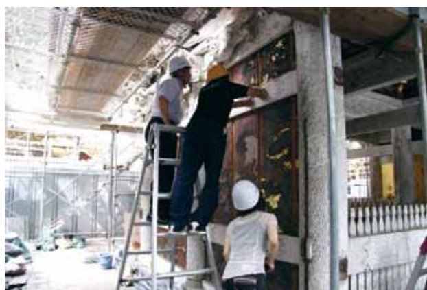
陽明門壁板絵画の現地調査