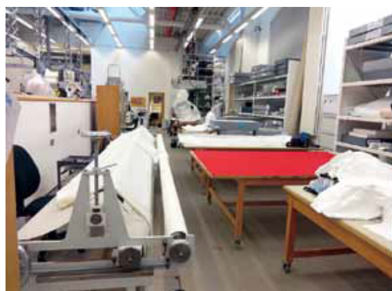
V & A 美術館のテキスタイル関係修復施設