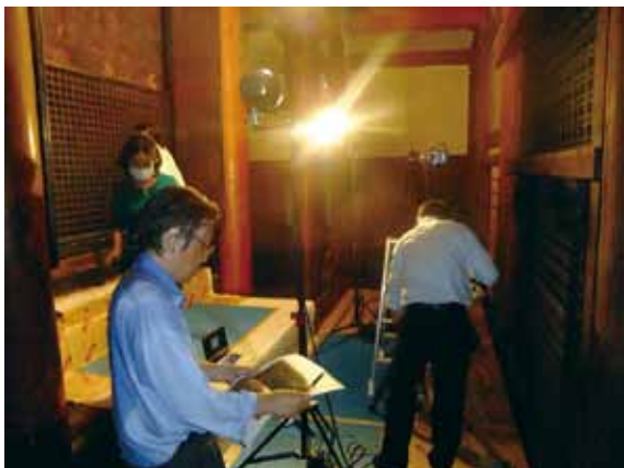
當麻寺裏板曼荼羅の調査風景（奈良博との共同研究）