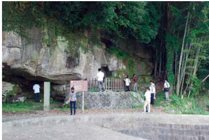
鍋田横穴における調査