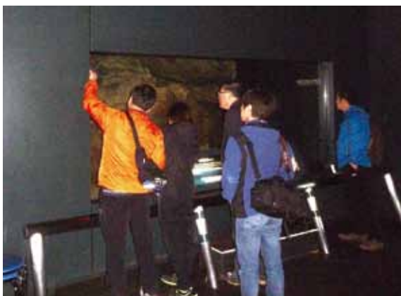
手宮洞窟の日韓共同調査