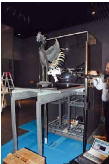
平等院の国宝鳳凰像の材料調査