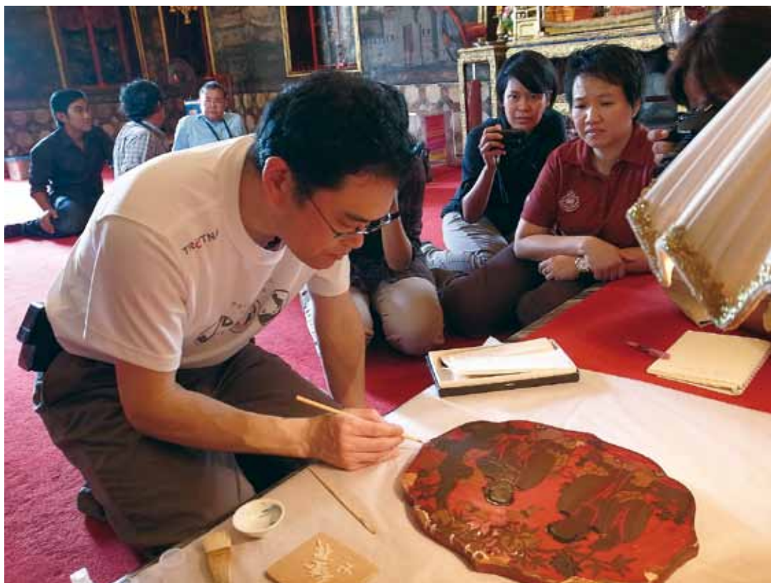
バンコク・ラチャプラディット寺院における漆屏の調査