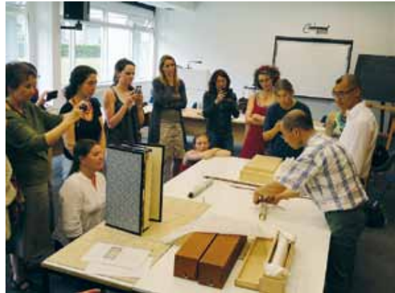
ベルリン国立博物館連合アジア美術館 におけるワークショップ