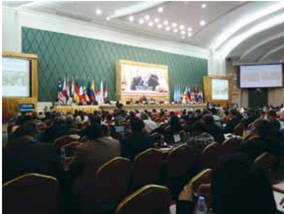
第37回世界遺産委員会(プノンペン、カンボジア)