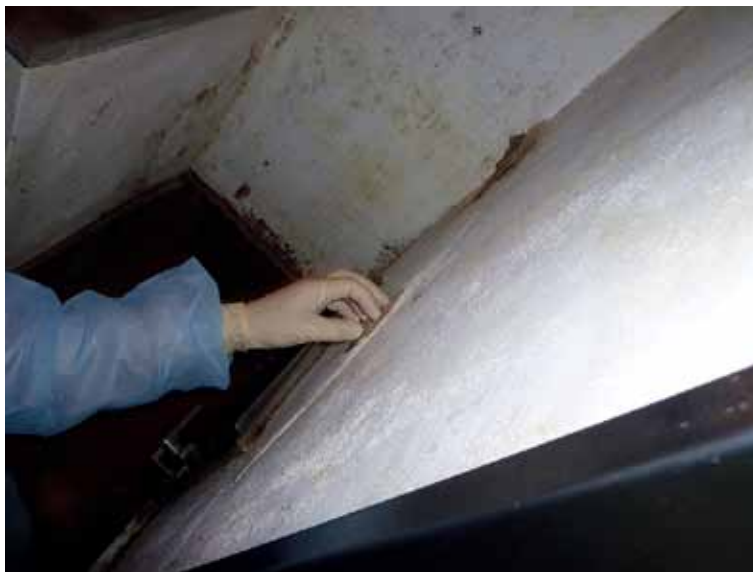
古墳等屋外に近い環境における微生物調査