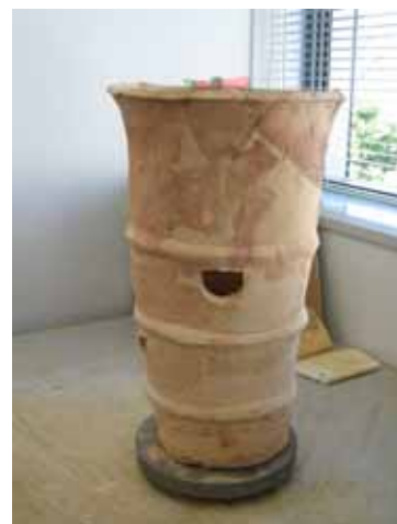
舞台1号墳円筒形埴輪(修復後)