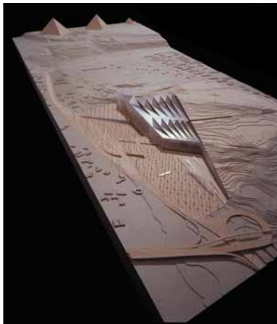
大エジプト博物館・国際コンペ当選案模型写真