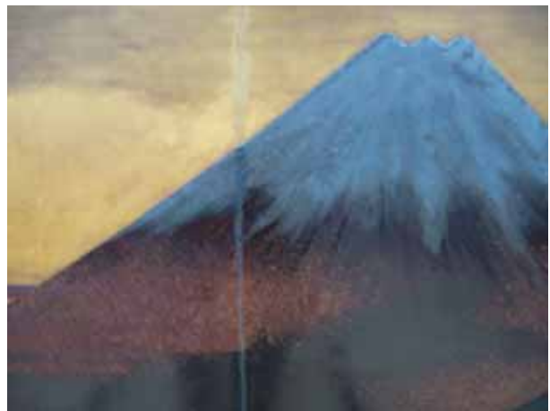
富士田子浦蒔絵額面（修復後）