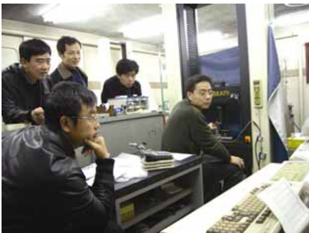
東京都立産業技術研究所での研修