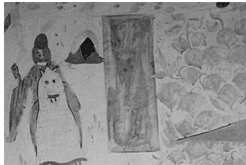
写真4 題箋部の赤外線写真