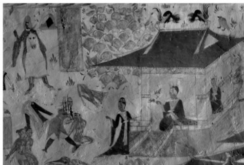
写真2 五百強盜婦仏因縁図（部分）の側光線写真