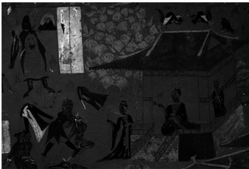
写真3 五百強盜帰仏因縁図(部分)の紫外線蛍光写真

壁画研究を行う上で、題箋に記された文字はきわめて重要な情報となる。南壁の各所には題箋が用意されているが、可視光下の観察では文字は確認されない(写真1左上部)。紫外線蛍光および赤外線写真法では、視認されない文字の痕跡が捉えられる可能性があるが、写真3(紫外線蛍光写真)の左上部の題箋内部には文字は認められない。写真4に示した題箋の赤外線写真でも、題箋の中には文字は認められない。写真1, 3および4で示した題箋に限らず、南壁のいずれの題箋でも、その紫外線蛍光および赤外線写真に文字は確認されなかった。このことは、南壁の壁画各所に用意された題箋には当初から何も文字が記されていなかったか、あるいは文字は記されていたが劣化によって視認されなくなり、またその劣化生成物も本研究の記録