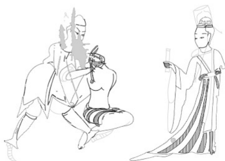
図2 五百強盜帛仏因縁図（部分）において 蛍光を発する部位