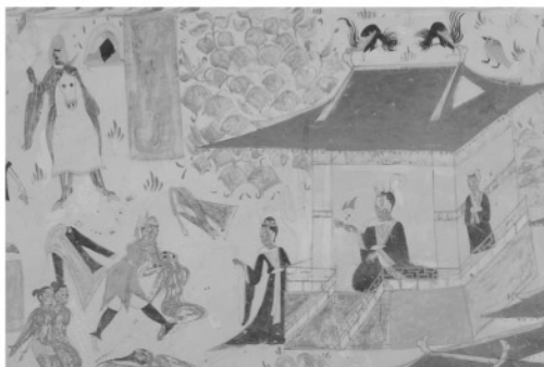
写真1 敦煌莫高窟第285窟南壁に描かれた五百強盜婦仏因縁図（部分）の正常光写真

南壁全体の表面形状の巨視的な観察を行ったところ、壁面は比較的平らで、将来的に大面積にわたる剥落が危惧されるような応力による壁面の大きなひずみは確認されなかった。壁画表面の微視的な形状については、写真1と同一部を側光線写真法によって記録した写真2を示して述べる。写真2では、壁面の肌理は比較的細かいが、図像とは無関係な凹凸が縦横にみられる。写真2の左下部の執行人の顔にみられる傷では、彩色層の欠損部から土壁に混入されてい