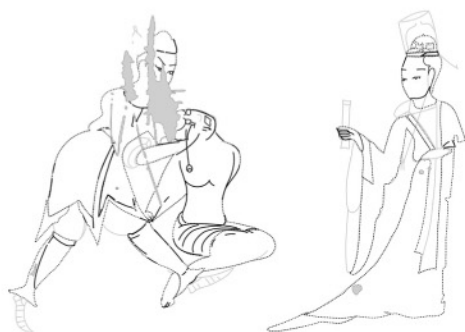
図1 可視光線像に基づく 五百強盜帛仏因縁図（部分）の線図

殿堂の左手に立つ大臣の衣服は、写真1では一様に黒色を呈するため、一色で塗りつぶされたように見える。紫外線を照射すると、図2に図示した領域で蛍光を発する。蛍光を発する原