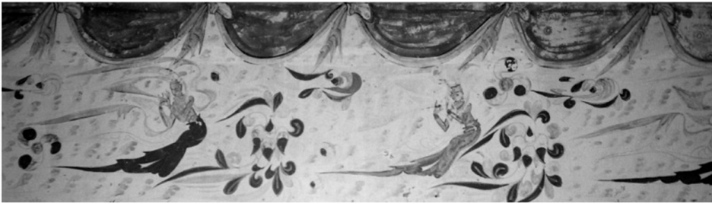
写真7 南壁上段(部分)の赤外線写真

どの炭素を含む材料による黒い描線の検出に適用されるほか、得られた像の濃淡から材質が識別される可能性をもつ 7,8) 。雲気文様B・Cの輪郭や飛天の下描きは赤い線で描かれているが(写真5)、これらの線は写真7では淡く記録されている。下描きは赤外線写真で淡く記録される材料によって描かれているため、彩色層の下にある下描き線を赤外線写真法で検出することは困難であった。飛天の天衣や雲気文様など、鮮やかな青い発色の色料が塗布された部位も淡く記録されている。一方、帷幕の青い縁の輪郭や襷を表現する黒い線は濃く記録されており、現存する黒い線の位置を明瞭に観察できる。これらの黒い線は炭素を含む墨による可能性がある。