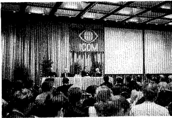
図-1 大会風景（開会式）