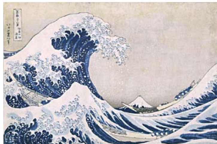
〈参考図版〉 葛飾北斎《富嶽三十六景 神奈川沖浪裏》 1831-33年頃／横大判錦絵／原本:千葉市美術館蔵 〈Reference plate〉 36 Views of Mount Fuji: The Great Wave off the Coast of Kanagawa by KATSUSHIKA Hokusai c 1831-33／Oban size／Original:Chiba City Museum of Art

In addition, this exhibition includes Fukuda's attention-grabbing 36 Views of Mount Fuji: The Great Wave off the Coast of Kanagawa , a mirror image of the iconic ukiyo-e of Katsushika Hokusai, which is used for the promotion of the international symposium.