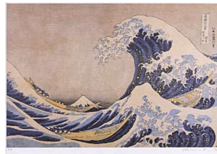
福田美蘭《富嶽三十六景 神奈川沖浪裏》 1996年／オフセット印刷・紙／作家蔵 36 Views of Mount Fuji: The Great Wave off the Coast of Kanagawa by FUKUDA Miran 1996／Offset on Paper／Collection of the artist