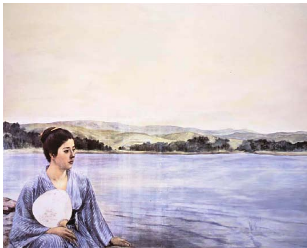
福田美蘭《湖畔》／1993年／アクリル絵具・パネル、カラーコピー／作家蔵 Lakeside by FUKUDA Miran／1993／Acrylic on panel, color copy／Collection of the artist

なお、今回の国際研究集会のPRイメージとして使わせていただいた、福田氏の《富嶽三十六景 神奈川沖浪裏》も同時に展示します。葛飾北斎の有名な浮世絵を左右反転させた同作品も、どうぞあわせてご鑑賞ください。