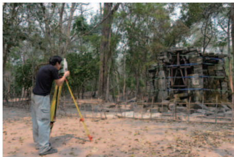
アンコール・タネイ遺跡における調査(カンボジア) Survey at Ta Nei Temple, Angkor (Cambodia)