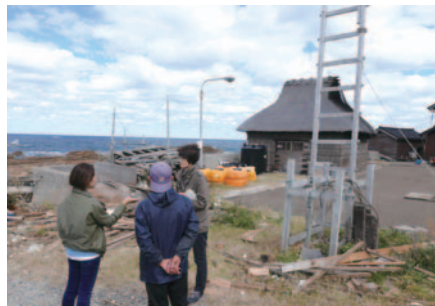
韓国国立無形遺産院との研究交流・奥能登の揚げ浜式製塩の共同調査 Research-related exchange with the National Intangible Heritage Center in the Republic of Korea: Joint survey on salt making in Oku-Noto, Japan