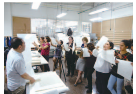
国際研修「ラテンアメリカにおける紙の保存と修復」(メキシコ) International Course on Conservation of Paper in Latin America (Mexico)

当研究所は世界の専門機関、専門家とも交流を図っています。調査研究、修復事業、人材育成などを通じ、アジアを中心とする各国の文化財保護に貢献しています。