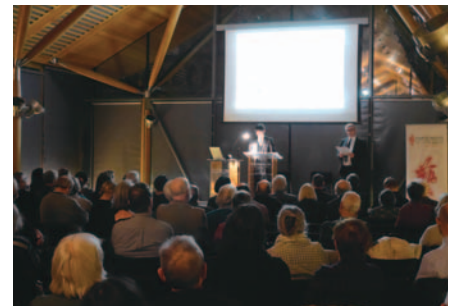
セインズベリー日本藝術研究所における講演 Lecture at the Sainsbury Institute for the Study of Japanese Arts and Cultures

The Institute is involved in interchange with institutions and professionals throughout the world specializing in the conservation of cultural properties. Through research, restoration projects and capacity development, it contributes to the protection of cultural properties of the world, mainly of Asian nations.