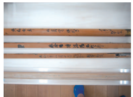
軸書き Inscriptions on rods