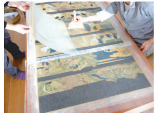
絵画の修復(肌裏打ち) Restoration of a painting -First lining-

Paintings of National Gallery of Victoria(Australia) is now under restoration in the Cooperative Program for the Conservation of Japanese Art Objects Overseas. Inscriptions were found on rods of hanging scrolls during restoration. They show that the mounting was done in 1682. It is impossible to reuse the mounting parts because they have deteriorated over a period of more than 300 years and have lost sufficient physical strength for supporting and protecting the paintings. However, they are very important as historical materials because it is not so common that the date of mounting is clear. The Center decided to reconstruct the hanging scroll form with those parts in order to prevent them from being scattered and lost.