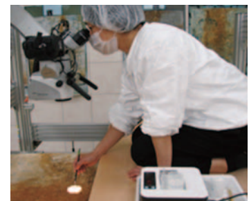
高松塚古墳壁画の修理作業 Restoration work on the paintings of Takamatsuzuka Tumulus