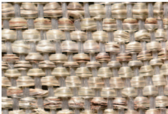
ワークショップで製作した葛布(経糸:絹、緯糸:葛) Kudzu-fu produced in the workshop(warp:silk, weft:kudzu)

Survey on techniques of making kudzu fabric: washing kudzu in the river