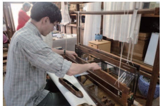
同 葛布を織る様子 Weaving kudzu-fu