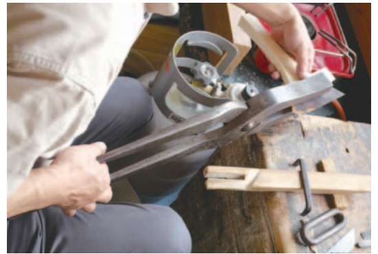
象牙と鼈甲を使った三味線撥製作の調査 Survey on the production of shamisen plectrum made from ivory and tortoiseshell

In an increasingly maturing society, the role that cultural properties are expected to fulfill is becoming all the more important. The Institute continues to conduct fundamental research so as to make this movement more certain.