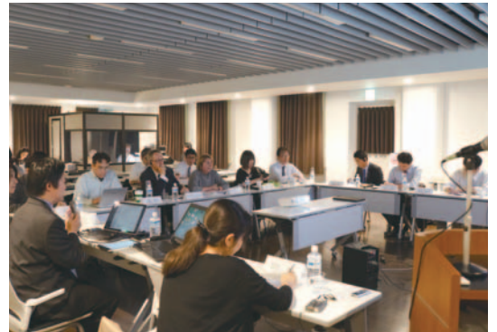
世界文化遺産の遺産影響評価に関する専門家会合 Expert meeting for examining the Japanese guidance for heritage impact assessment