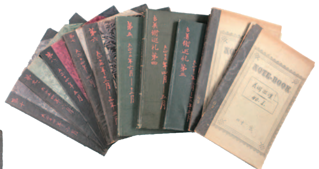
田中一松資料・大正~昭和初期のノート Research materials of TANAKA Ichimatsu, Notebooks in Taisho and early Showa periods