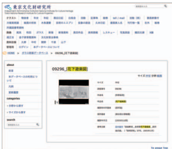
ガラス乾板データベース Database of glass photographic plates

The Institute owns approximately 260,000 photographs of artworks and cultural heritage, including over 20,000 glass photographic plates. The database of the glass photographic plates gains a large number of accessing the website for its value as historical source. The open access of the images on the Internet is limited, but the high-resolution images are available to see in the Library.