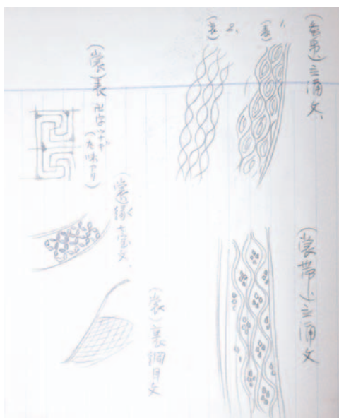
仏画の調査ノート 截金のスケッチ 大正15年 Research note of Buddhist paintings, Sketch of kirikane, 1926