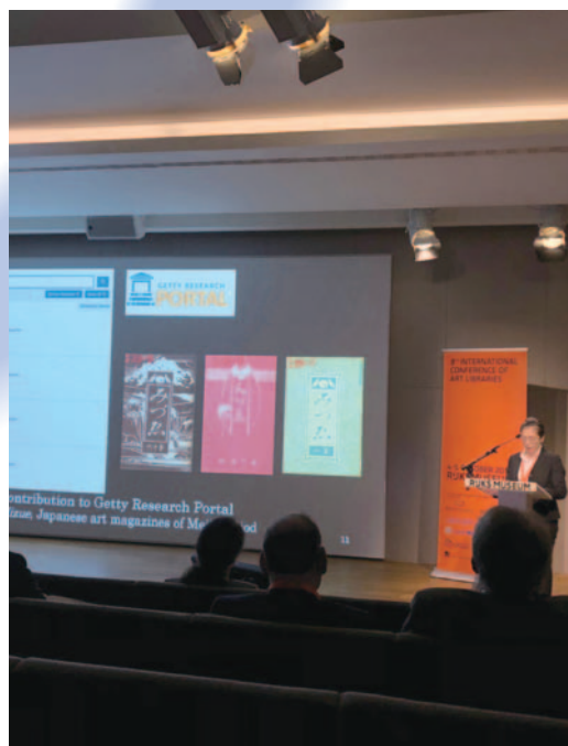
国際美術図書館会議での発表 (アムステルダム国立美術館、オランダ) Presentation at the International Conference of Art Libraries (Rijksmuseum, The Netherlands)