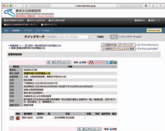
東京文化財研究所 蔵書検索 Library collection search of the Institute

Both literature and photographs are essential for art research. Since its establishment in 1930, the Institute has been collecting books and photographs on art. Bibliography information has been disclosed on the website of the Institute. However, the library information management system has been introduced anew, aiming for more effective dissemination of information. Furthermore, the digital archive of the art auction catalogues in Japan, which is the remarkable collection of the Institute, has been completed and released inside the Library. For access to the Library, please see page 29.