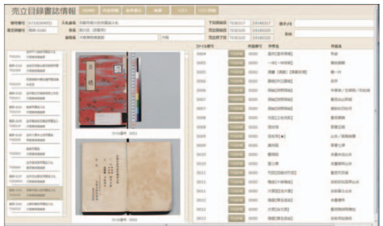
売立目録デジタルアーカイブ Digital archive of auction catalogues

当研究所には約26万点の美術や文化遺産のアナログ写真を所有しており、その中には2万点を超えるガラス乾板も含まれています。ガラス乾板データベースは歴史的資料価値が高く、アクセス件数の多いウェブサイトとなっています。インターネット公開している画像は画素数を制限していますが、資料閲覧室では高解像度の画像が閲覧できます。