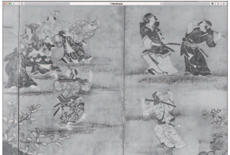
昭和10年以前に撮影された、狩野長信筆「花下遊楽図屏風」(現・東京国立博物館蔵)のガラス乾板写真のデジタル化画像 Digitized image of the glass photographic plates taken before 1936. Merrymaking under the Cherry Blossoms by Kano Naganobu (Tokyo National Museum)