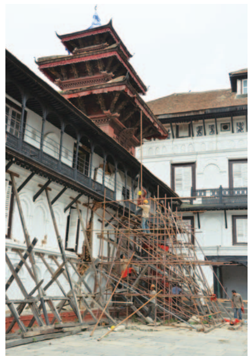
応急安定化作業中のハヌマンドカ王宮内アガンチェン寺 Emergency stabilization work at Aganchen Temple of Hanumandokha Palace

In Nepal, precious cultural heritage represented by the World Heritage Site of “Kathmandu Valley” was severely damaged by the Gorkha Earthquake, which occurred on April 25, 2015. The Institute has been cooperating with the country’s authorities in order to facilitate their efforts in rehabilitation and to strengthen the structure for the protection of cultural heritage. Focusing, in particular, on the study for the restoration of historic buildings in Hanumandokha Palace, Kathmandu and the study for the preservation and rehabilitation of historic settlements in the valley, the Institute has been conducting multifaceted activities including transfer of techniques to the Nepalese officers and engineers as well as the formation of their cooperative networks.