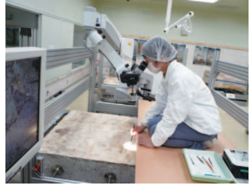
高松塚古墳壁画のクリーニング作業 Cleaning a mural painting of Takamatsuzuka Tumulus

Conservation works are being conducted in Asuka-mura, Nara Prefecture for the mural paintings of Takamatsuzuka and Kitora Tumuli. Since removal of stain from the painting surface is important in the case of the former, studies are being conducted to develop methods for cleaning and for consolidating plaster. It is necessary to try many kinds of tests and experiments so as to select suitable methods that will not cause any damage to the original. In the case of the latter, the main work to reconstruct the fragments to their original positions finished last fiscal year, and the reconstructed mural paintings have been exhibited in the new museum. These conservation works for the mural paintings of both tumuli are based on current study of restoration materials.