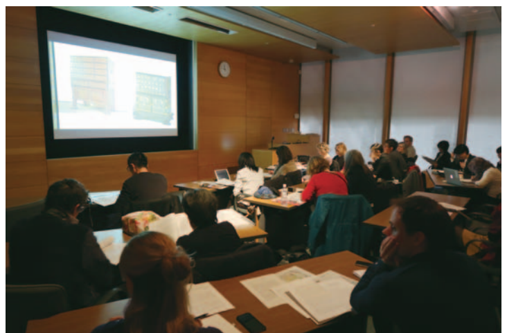
左:公開研究会「南蛮漆器の多源性を探る」予稿集

Left: International Symposium Proceedings "In Search of the Multiple Origins of Namban Lacquer"