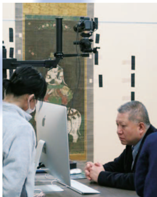
国宝・普賢菩薩像の調査（東京国立博物館との仏教美術等の光学的手法による共同研究）

Investigation of the National Treasure Fugen Bosatsu (Samantabhadra) Image (study with optical analyses of Buddhist art and others, in collaboration with the Tokyo National Museum)